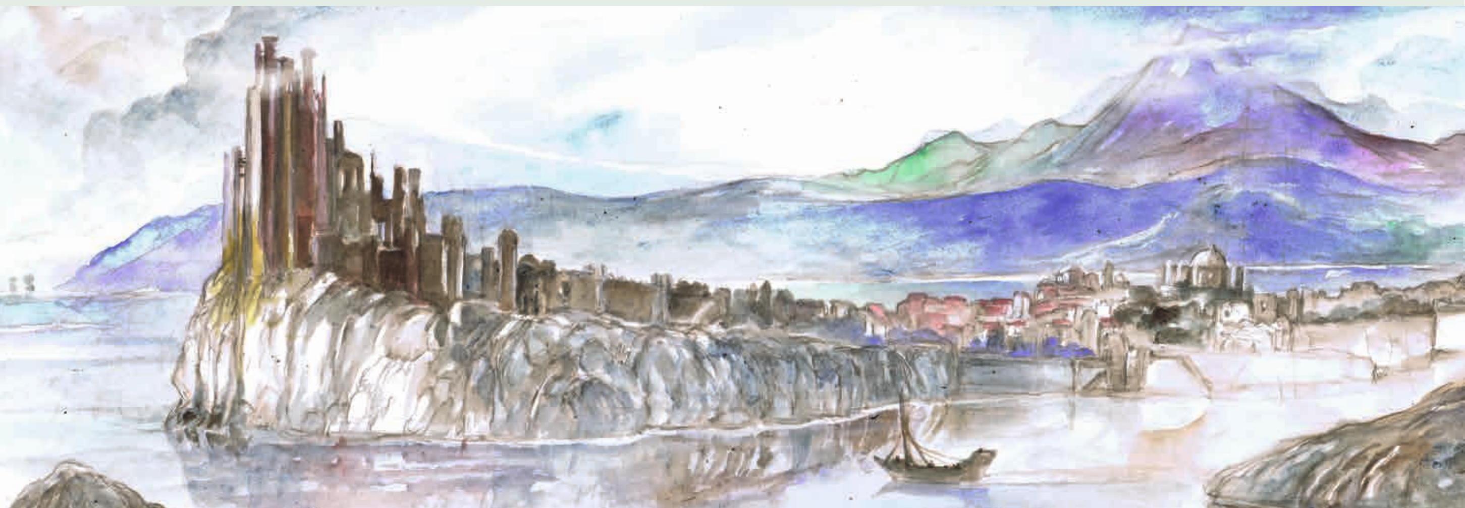
Vue de Port-Réal.