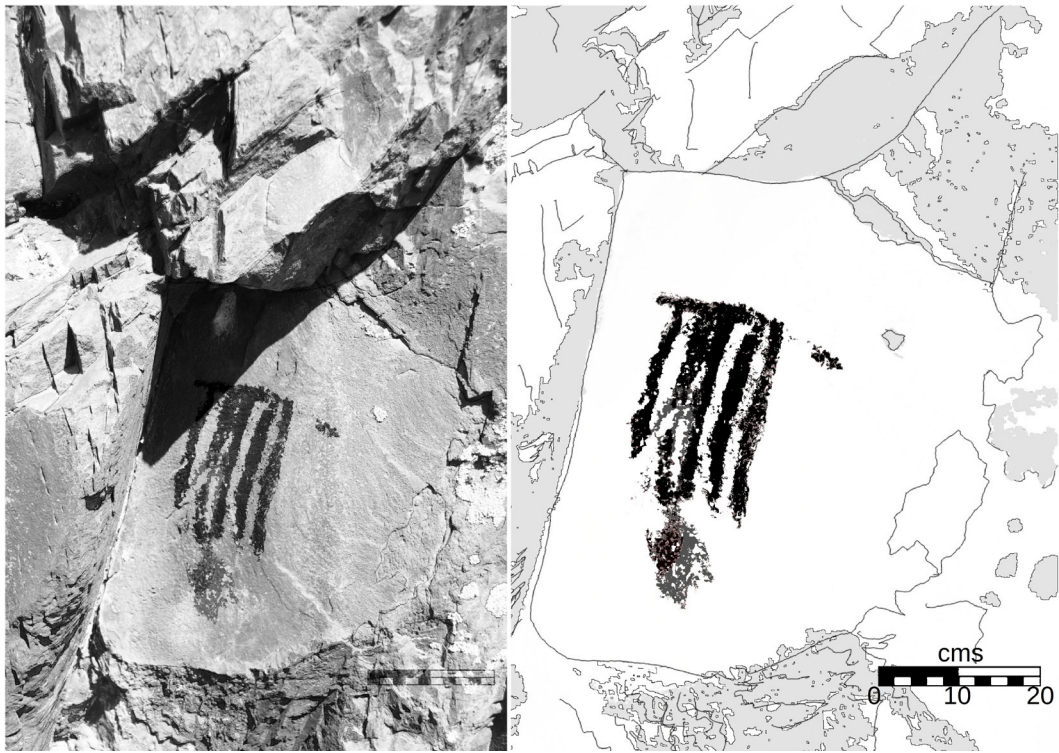
Fig. 4. Motivo 2 geométrico.

a estilos propuestos previamente (Gradín et al. 1976; Gradín, 1978).