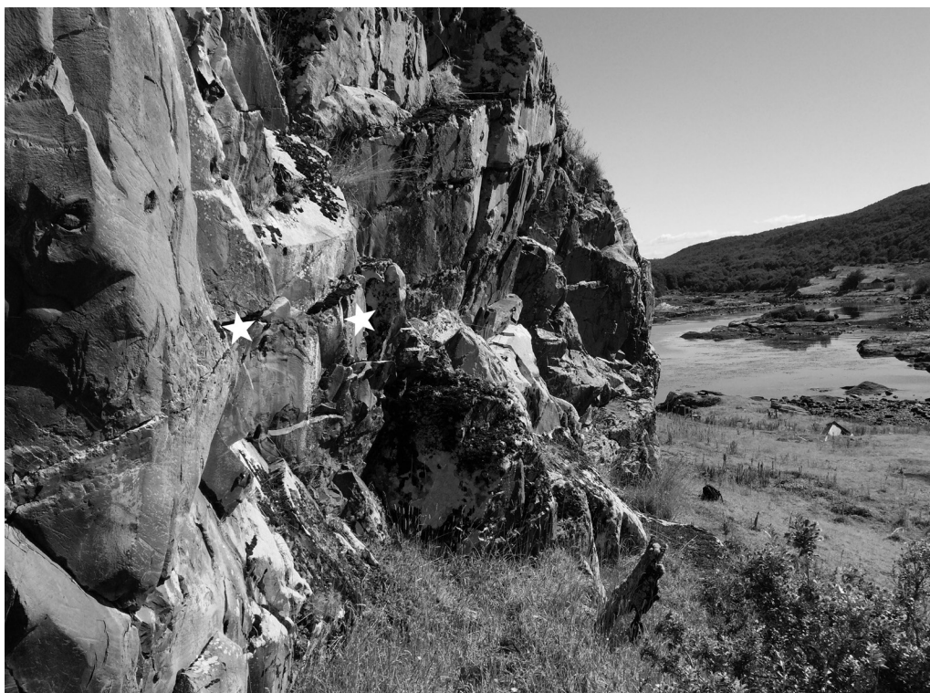
Fig. 2. Ubicación de las representaciones en el sector este del sitio.

El segundo motivo está compuesto por una línea paralela roja, de la que se desprenden cinco líneas verticales paralelas, de 18 cm de ancho y 28 cm de largo, a 1,42 m del suelo actual del sitio (Fig. 4). En el mismo se advierte la posible presencia