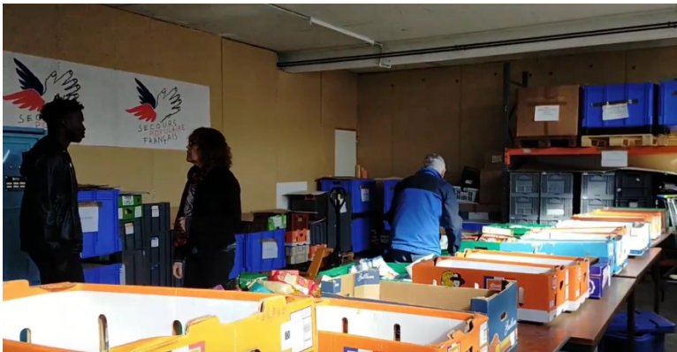
Photographie 2. Distribution alimentaire au Secours Populaire.