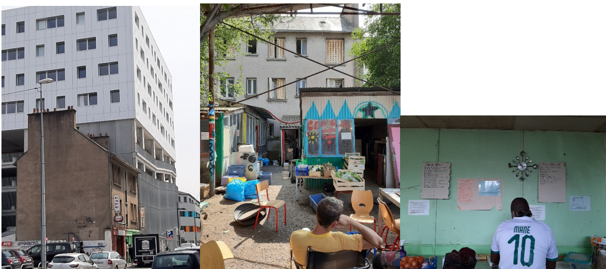
Photographie 3. L'Autre Cantine, et les espaces de préparation des repas