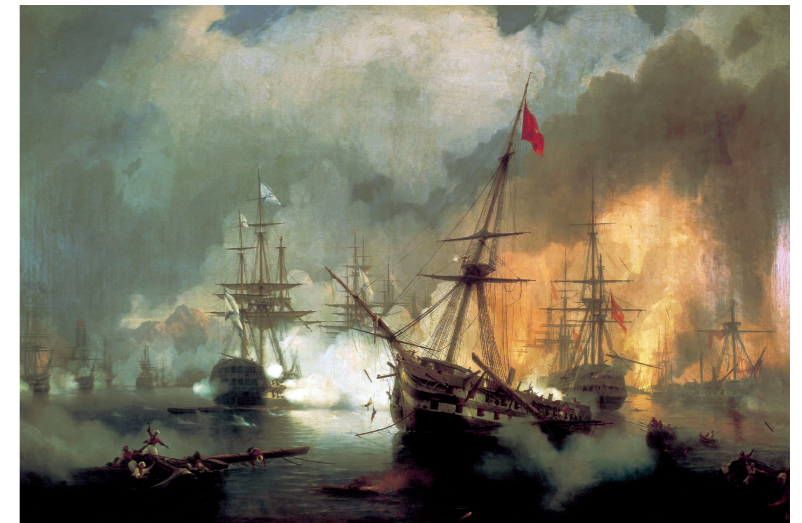
Fig. 2 – La bataille de Navarin. © I. AÏVAZOVSKI, 1846. ■

Uni et les autres puissances maritimes de l'époque, qui se lancent dans une course aux armements navals jusqu'à la Première Guerre mondiale. Ces évolutions accroissent considérablement les coûts de construction et d'entretien des navires et contraignent à disposer d'infrastructures en rapport : arsenaux, pour la construction, l'entretien et l'armement des navires ; et bases relais disséminées dans le monde entier pour assurer le ravitaillement et la réparation. Depuis la fin du XVII e siècle, la possession d'empires coloniaux par les puissances européennes mondialise la guerre sur mer. Nonobstant, ces bouleversements technologiques ne modifient pas substantiellement les buts assignés aux marines sur le temps long. La légitimation de la possession d'une flotte de guerre se trouve dans sa capacité à protéger les littoraux contre une invasion, tout autant qu'à assurer le blocus des ports de son adversaire, à escorter les navires de commerce afin