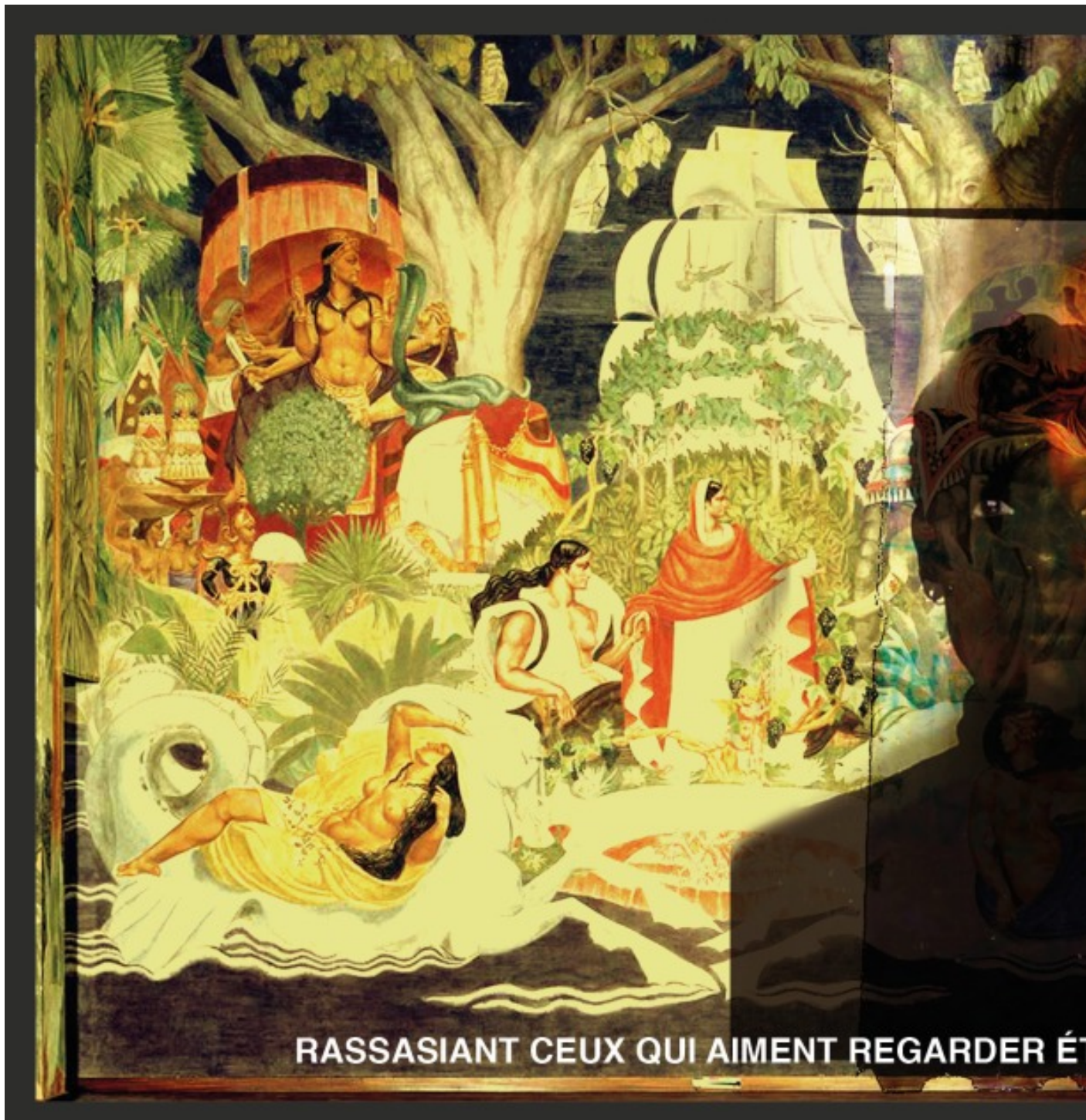
Sybil Coovi Handemagnon, Car, il est des choses que l'on ne doit plus confondre [Denn es gibt Dinge die man nicht mehr verwechseln darf], 2021, digitale Collage.

Sondern auch Zugang zur Gesundheit gewähren oder ihn versagen.