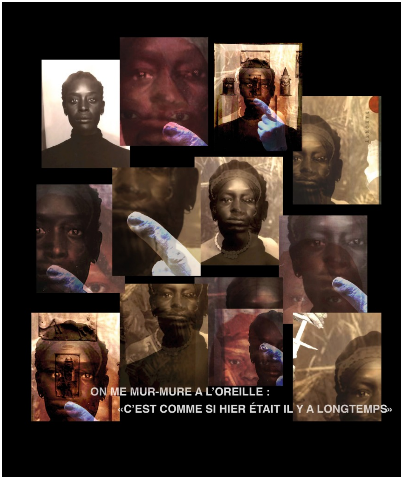
Sybil Coovi Handemagnon, Parce que Hier ne sera pas comme Demain , 2021, collage numérique. And only an instant later.