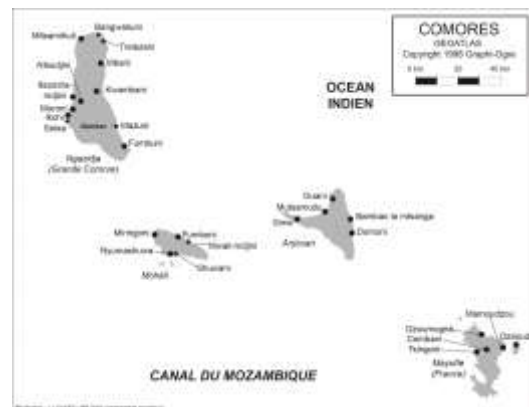
Carte 2. L'archipel des Comores