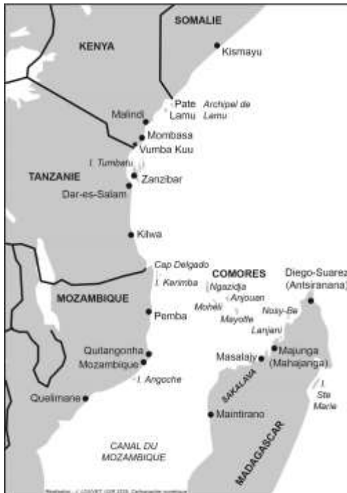
Carte 1. L'océan Indien occidental.

de Mohéli » ( Sharia sha shungu sha Mwali ). Il s'agit de la transcription, en comorien de Mohéli et en caractères latins, de différents mémoires écrits en caractères arabes sous la dictée d'un ou plusieurs détenteurs de l'histoire orale, saisie à l'ordinateur en 2002 6 . On y trouve l'histoire du fondateur du shungu , un règlement en dix points concernant les droits et devoirs des membres du shungu , puis, pour chaque cérémonie, la liste (malheureusement incomplète) des denrées qui doivent être présentées. Contrairement à ce qu'induit son titre, le texte semble tout autant enregistrer les pratiques que dire seulement la règle.