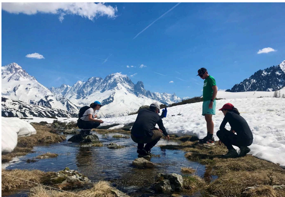
Illustration 2 : Des étudiants en pleine observation scientifique