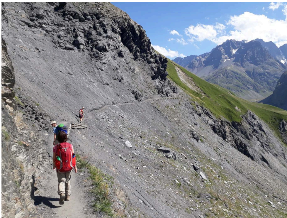
Illustration 3 : Une immersion dans les Écrins, terrain du programme Refuges Sentinelles