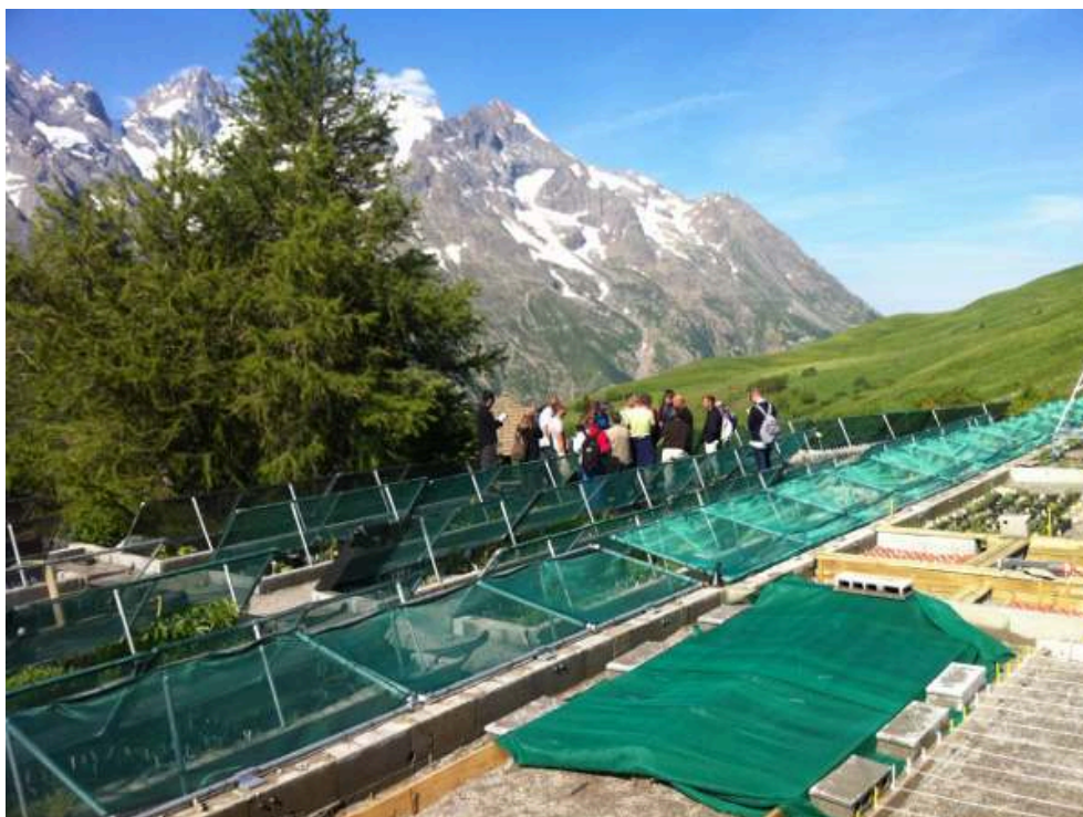
Illustration 1 : Une visite du Jardin du Lautaret et de ses installations scientifiques