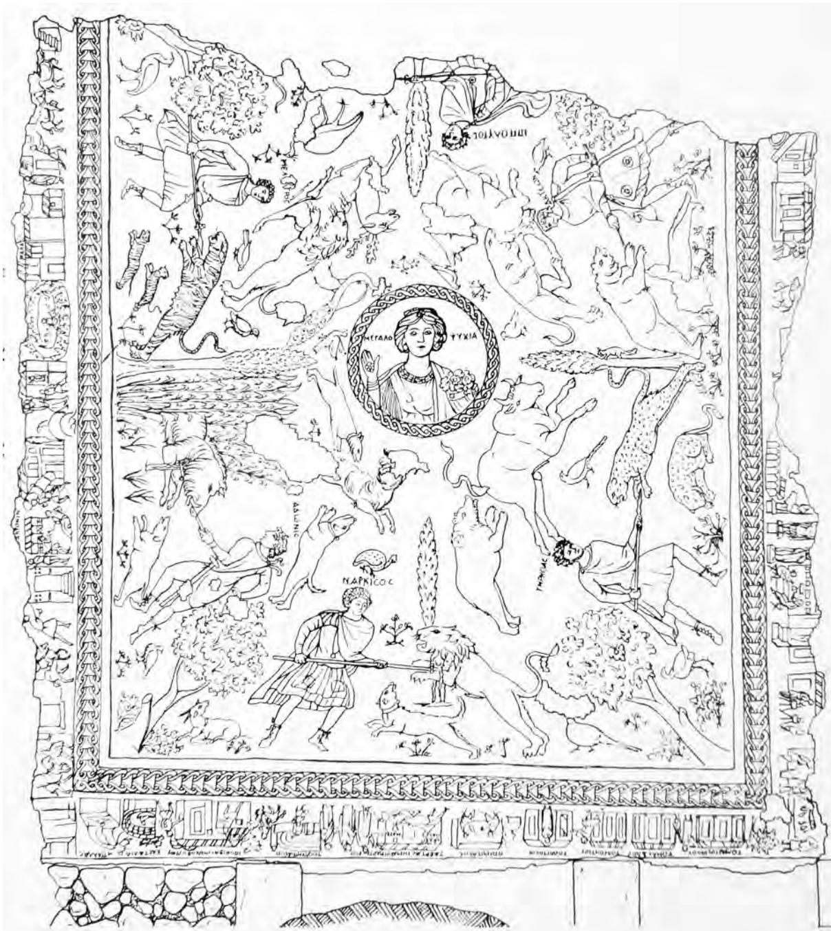
Figure 1. Plan d'ensemble de la mosaïque de Megalopsychia. Cliché 5661 (LEVI 1947, I fig. 136).