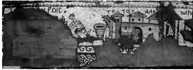
Figure 4. Fragment de bordure topographique (Antioche, secteur 11-P). Visual Resources Collection, Department of Art and Archaeology, Princeton University. Cliché 2379 (LEVI 1947 II, pl LXXIVb).