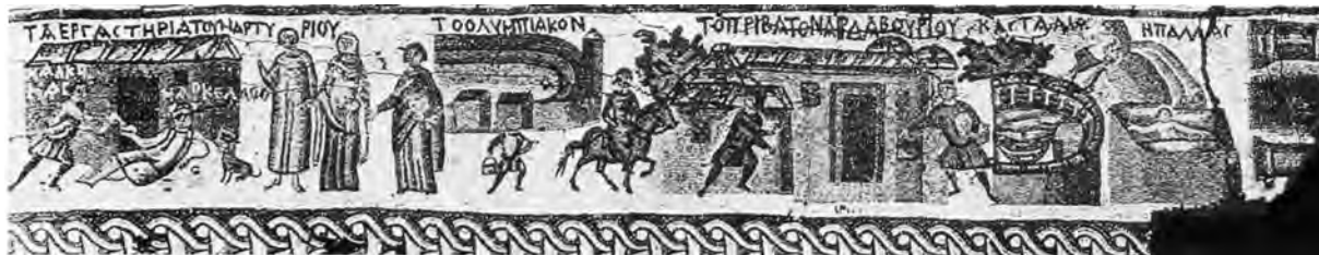
Figure 3. Bande sud de la bordure topographique, partie ouest (à droite dans le sens de la lecture) : les ateliers du Martyrion, Chalcomas et Marcellos, le stade olympique, le privaton d'Ardabourios, Castalie, Pallas. Visual Resources Collection, Department of Art and Archaeology, Princeton University. Cliché 5650 (LEVI 1947 II, pl. LXXIXa).

devant les « ateliers du Martyrion » ( infra ), sont en interaction. Le personnage couché est appelé Markellos, le personnage debout, qui lui verse du vin d'après J. Lassus 17 et D. Levi 18 , est désigné comme χαλκομαῖς ( Chalcomas ). Il peut s'agir d'un nom propre ou d'un nom de métier (« artisan en bronze », voir plus bas), lui-même susceptible d'être utilisé comme un sobriquet. L'explication de la présence de ces indications reste à trouver. S'agit-il d'une allusion à des personnages réels, dont l'un serait par exemple le commanditaire de la mosaïque ? Le caractère littéralement biographique de la mosaïque de Kimbros déjà évoquée incite à considérer cette hypothèse avec sérieux, mais il peut aussi s'agir d'une allusion littéraire, qu'il faudrait pouvoir identifier. À rebours, l'étude de ces représentations humaines signale aussi le caractère répétitif de la composition de l'ensemble : le motif du banqueteur et celui des joueurs apparaissent en effet à plusieurs reprises 19 .