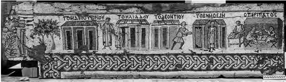
Figure 2. Bande sud de la bordure topographique, partie est (à gauche dans le sens de la lecture) : les lieux de Maiorinos, Héliadès et Léontios, le démonion, le peripatos. Cliché 5649 (LEVI 1947, II, pl. LXXIXb).