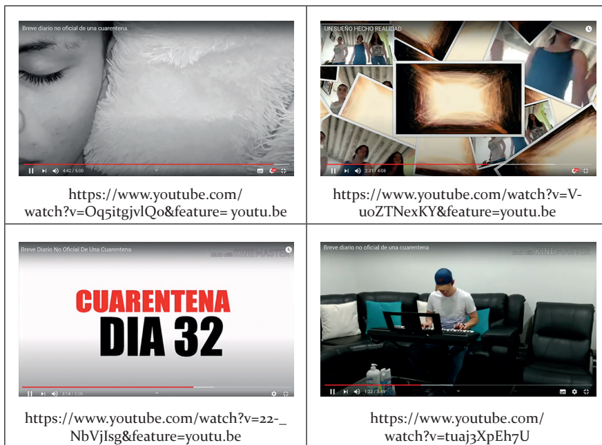
Figura 2. Ejemplos de videos con el tema: “Diario no oficial de una cuarentena” (febrero-noviembre de 2020)

de dos minutos, pero haciendo énfasis en procesos de autoevaluación, coevaluación y heteroevaluación.