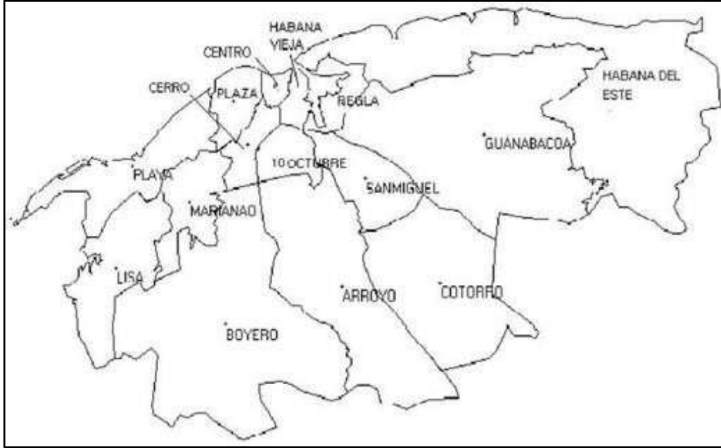
Carte des quartiers (municipios) de La Havane 2 .