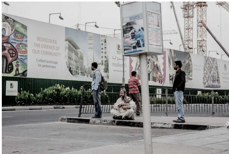
Invisibilisation du chantier de destruction du centre-ville de Doha (Qatar) par les affiches publicitaires du projet de rénovation, 2011.

Pendant toute la durée des travaux, des images géantes d'un mode de vie urbain fantasmé par l'alliance de la « tradition » et de la « modernité » ont été soigneusement placardées pour invisibiliser la violence engendrée par cette entreprise de rénovation du centre-ville.