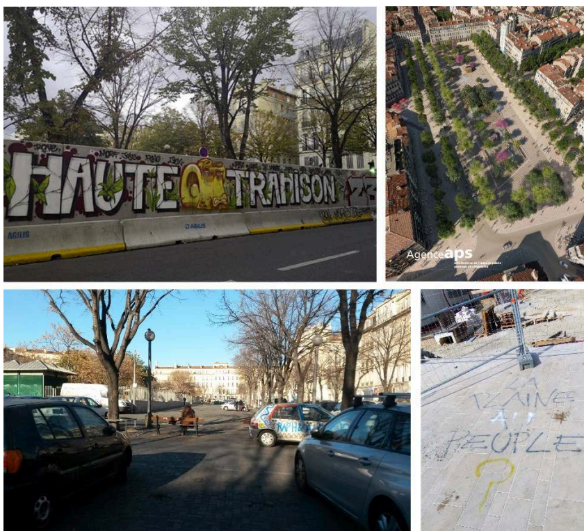
Figure 6. La place Jean-Jaurès à Marseille

De gauche à droite et de haut en bas : vue de la place avant-projet le 8 janvier 2017 ; vue aérienne du projet de l'agence APS ; vue du mur installé pendant le chantier autour de la place par la maîtrise d'ouvrage ; vue sur une inscription au sol pendant le chantier et la journée de terrain.