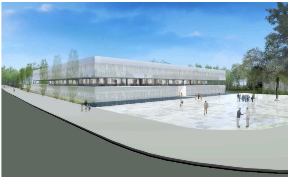
Figure 4. La Cité des métiers et la place des Artisans, photomontage de l'avant-projet