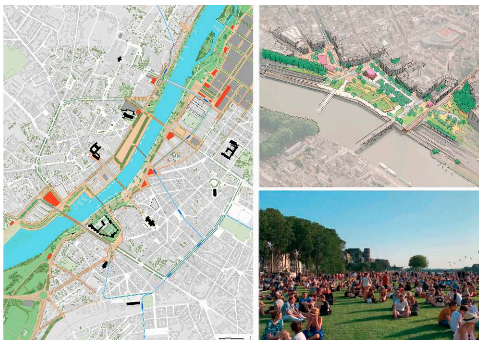
Figure 3. Centre-ville Maine

À gauche : document cadre du projet « Angers Rives nouvelles » en 2013 (Atelier Grether, Phytolab) ; à droite : en haut, dessin du projet « Cœur de Maine » en 2015 (Phytolab) ; en bas, l'esplanade le jour de sa réouverture après le confinement du printemps 2020.