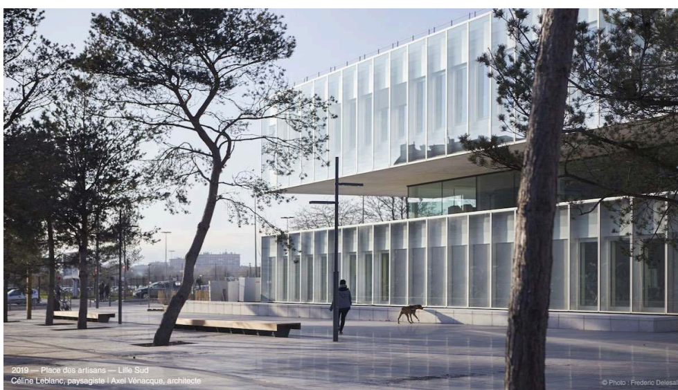
Figure 5. La place des Artisans au lendemain de son ouverture