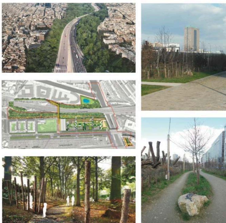
Figure 2. La Forêt linéaire

À gauche : images du projet (perspective et plan-masse) ; à droite : deux vues de l'état des lieux en 2018.