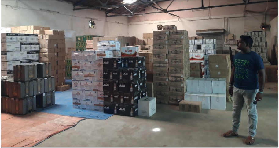
Photographie 4 : Dépôt de Sree Murugan Enterprises

Dans cet entrepôt localisé en périphérie de Pondichéry (mais toujours sur le Territoire), l'entreprise reçoit de l'alcool en provenance de toute l'Inde et de l'étranger, et paye une taxe annuelle de 50 000 roupies (environ 600 euros) auprès de l' Excise Department pour le stockage. Cliché Goreau-Ponceaud, juin 2020.