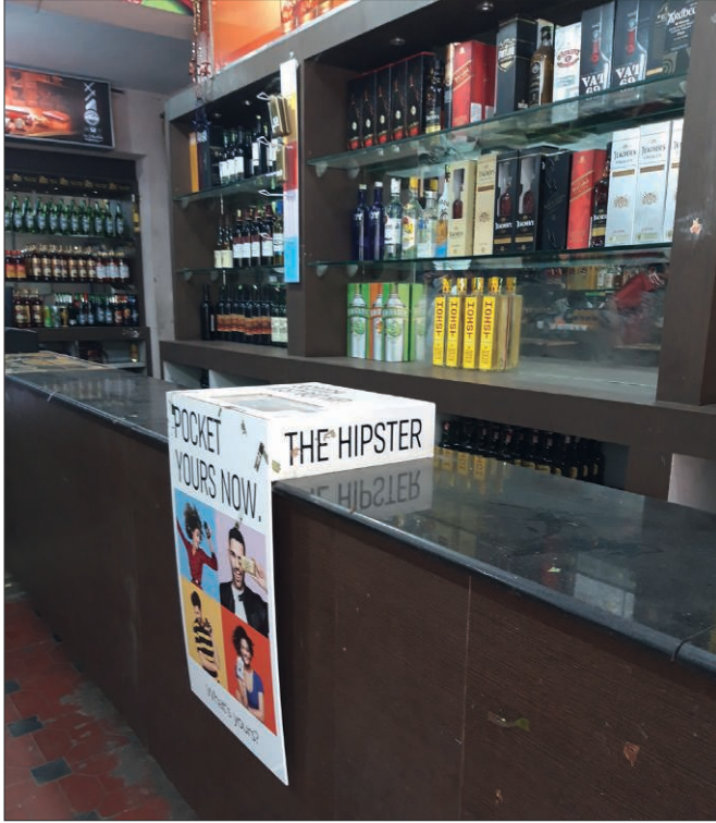
Photographie 6. La figure des hipsters : nouvelle cible des marchés Goreau-Ponceaud, juin 2020.

Comme le montre l'entretien avec S.S. Pankaj, si le renouvellement d'une licence est quasi-automatique, le processus d'obtention quant à lui est long, éprouvant et renvoie spécifiquement à cette imbrication spécifique entre alcool et politique.