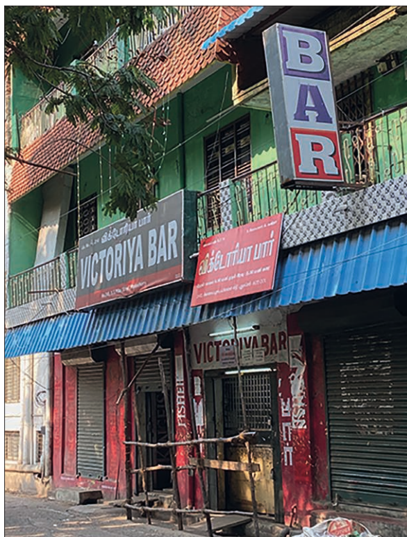
Photographie 5. Un BAR sur Anna Salai

les magasins de détail, les heures de vente autorisées sont entre 8 heures et 23 heures. À Pondichéry, on dénombre 309 établissements détenteurs d'une licence de type FL2, majoritairement localisés le long des grandes artères et des infrastructures et équipements urbains (gare routière, hôpital, boulevards). Les établissements détenteurs d'une licence FL2 choisissent leur fournisseur (les grossistes détenteurs de la FL1) en fonction des marques qu'ils souhaitent vendre (c'est surtout vrai pour les hôtels et restaurants). Chaque commande effectuée auprès du fournisseur passe par une déclaration en ligne ( pro forma transaction ) des quantités achetées auprès de l' Excise Department afin, pour ce dernier, de faire un inventaire en fin d'exercice au sein du godown pour éviter tout marché noir. Si les détenteurs des licences FL2 achètent de l'alcool auprès des fournisseurs, ceux-ci ont également le droit d'en vendre, ce qui, pour les deux plus gros syndicats de détaillants, est perçu comme une concurrence déloyale et à ce titre souvent dénoncée.