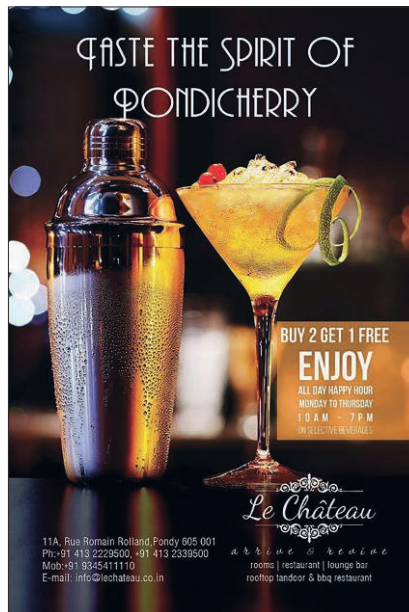
Photographie 2. Affiche publicitaire placée sur la devanture du bar « Le château », rue Romain Rolland ( White Town ), Pondichéry

C'est ainsi la singularité de Pondichéry, à la fois traduite dans sa législation et exprimée au travers d'un imaginaire touristique promu autour de l'héritage colonial et d'un supposé « mode de vie à la française » (photographie 2), qui attire la majorité des touristes indiens au sein de l' Heritage Town , ce bout de ville caractérisé par un patrimoine bâti à l'architecture distinctive, d'inspiration tantôt tamoule, tantôt coloniale, ou encore mêlant ces deux styles 26 .