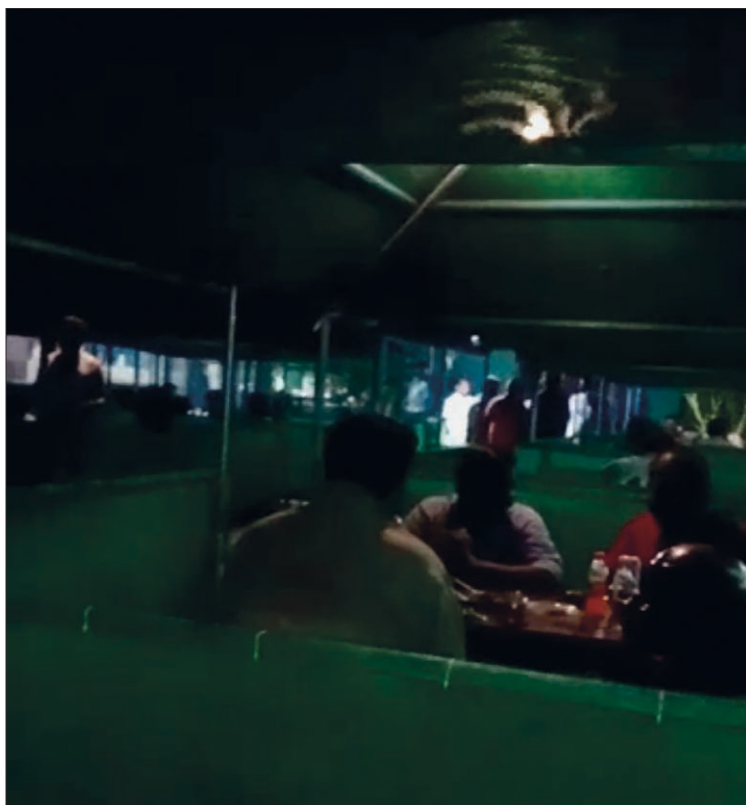
Photographie 3. Dans un bar du Tamil Nadu

Il semble donc que, pour ses nombreux visiteurs, souffle un vent de « liberté » à Pondichéry comparativement aux États voisins : l'alcool y est consommé librement, dans des lieux diversifiés, les plus centraux accueillant de manière privilégiée une clientèle jeune et féminisée. Cette situation tranche par rapport à celle de nombreuses localités du Tamil Nadu où, à l'exception de quelques quartiers riches de Chennai, la consommation d'alcool s'effectue dans des bars sombres, enfumés, souvent réservés aux hommes, à l'instar des anciennes permit rooms (photographie 3) 33 . Reste que la segmentation des lieux et des temporalités de la consommation d'alcool à Pondichéry est bien réelle. Elle dessine une géographie urbaine fragmentée que l'étude de l'alcool, sans en constituer la raison majeure, contribue à expliquer.