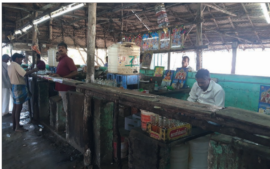
Photographie 7. Dans l' arrack shop de Lakshmanam

On vend plus de 600 litres d'alcool par jour. Une petite bouteille coûte 30 Rs. Je ne peux même pas te dire quel est le degré d'alcool du liquide que nous vendons, car nous n'avons rien pour le mesurer et parfois il change. Bon si tu vois beaucoup d'hommes, sache que les femmes viennent également ici. Ce sont des femmes qui vivent seules, dont personne ne s'occupe. Ce sont des veuves ou encore parfois des mendiante. Ces femmes sont très fortes. Tu verrais comme elles tiennent l'alcool ! Elles sont vraiment fortes. C'est l'alcool qui les fait tenir comme tous ceux d'ailleurs qui travaillent comme coolies. Prends et goûte ce sera bon pour toi. Cela rend fort ! Cela te permettra d'affronter une grosse journée de travail ! [...] Il y a en moyenne pour un jour normal entre 700 à 800 personnes. Là-dedans je ne te compte pas ceux qui reviennent jusqu'à 4 fois. Souvent ceux qui ont des métiers difficiles. [...] En gros, on fait entre 1 et 2 lakhs [1 200 à 2 400 euros] de recettes par jour. Aux recettes de l'alcool il faut ajouter celles de la location d'emplacements pour la vente de nourriture. Chaque échoppe doit verser un loyer de 100 roupies [un peu plus d'un euro] par jour. Cela peut paraître cher mais c'est assez rentable [...] À dire vrai c'est assez triste de voir toutes ces personnes souvent seules, assises sur le sol à boire et à manger quelques pois grillés (Lakshmanam, entretien, Lawspet Main Road, 05/02/20).