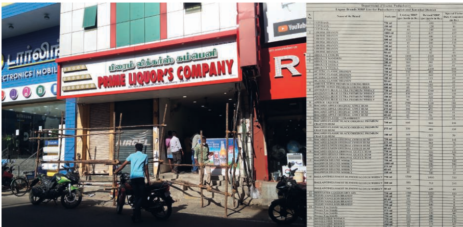
Photographies 1a et 1b. Nouveaux prix et baisse de la fréquentation

Loin des images si courantes dans le reste de l'Inde des longues files d'attente permettant d'atteindre le comptoir et d'acheter le liquide enivrant tant attendu, les magasins d'alcool de Pondichéry donnaient tous à voir, de longs mois durant, des barrières inutilisées que les rares clients franchissaient paisiblement.