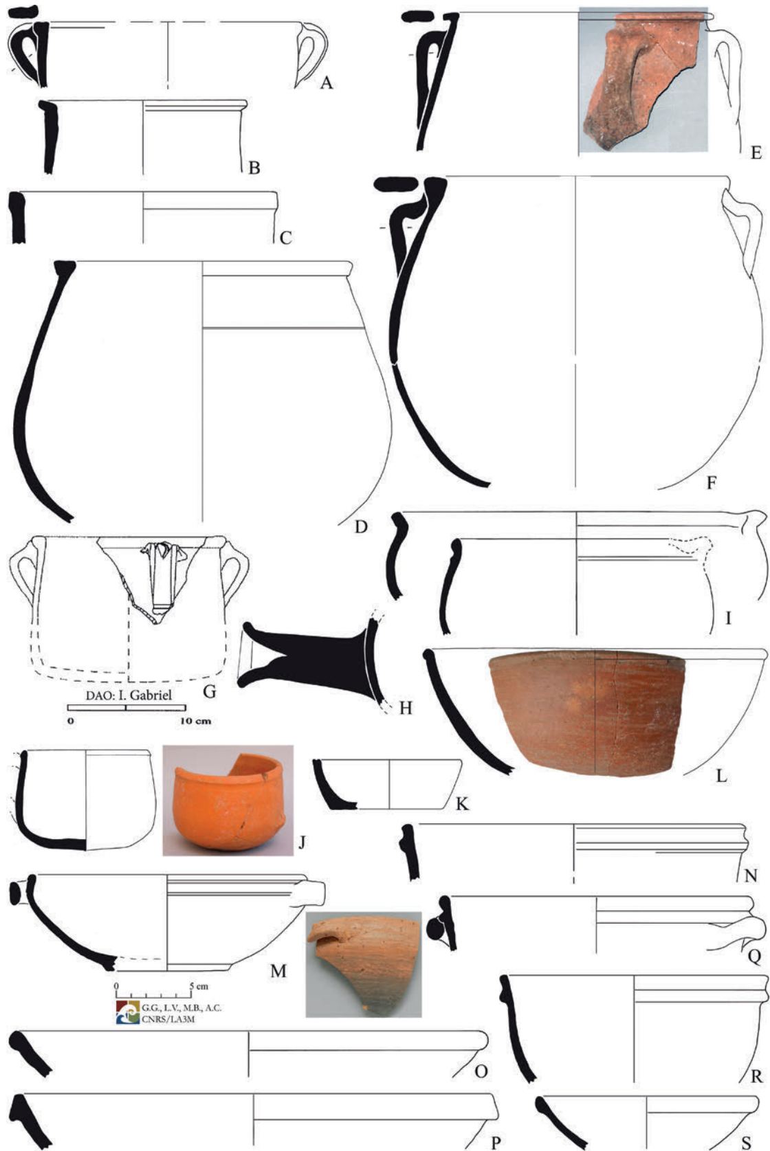
Figure 3. Marmites, poêlons et jattes fin XVIII e - XIX e s. Guadeloupe A, N : EHPAD, Basse-Terre ; B, C, G, N-S : Poterie Fidelin Les Saintes Terre-de-Bas ; Martinique D-F, I, K : Saint-Pierre Château Perrinelle ; H, M : Maison Desroc-Bureau du Génie et des Ponts et Chaussées ; L : Rue Isambert ; J : Habitation Galion, La Trinité