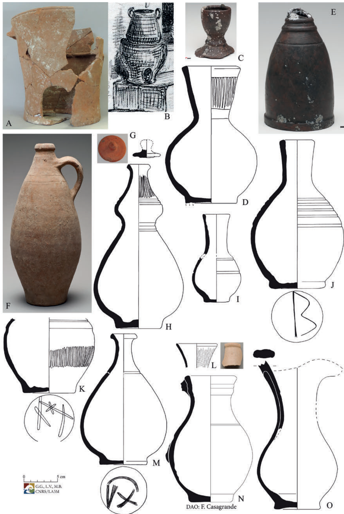
Figure 4. Réchaud, carafes, bouteilles et pichets, Saint-Pierre avant 1902. A : Allée Pécol ; B : extrait scène de la vie urbaine au 19 e s. B.P. ; C –E : Rade de Saint-Pierre Drassm ; G-I, L, M : Château Perrinelle ; F, J, K, N : cases des travailleurs ; O : Maison Desroc