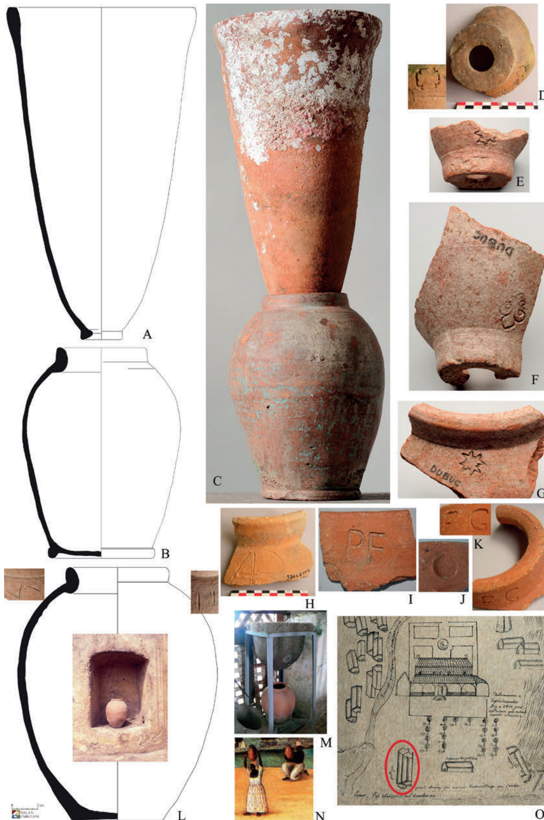
Figure 1. A-C : Moule à sucre et pot à mélasse, Drassm-SRA Anse Cafard, Martinique et coll. part. D-G : Martinique Château Dubuc, La Trinité, SRA, LA3M ; I-K : Guadeloupe Poterie Fidelin, Basse-terre ; H, L : Pots à mélasse, cases des travailleurs, Château Perrinelle, Saint-Pierre ; M : Pierre à filtrer et jarre, Martinique Habitation Galion, La Trinité ; N : extrait du tableau de Bassot 1765, Fort-de-France, MRHE ; O : Anse Latouche, Le Carbet, Poterie 1726