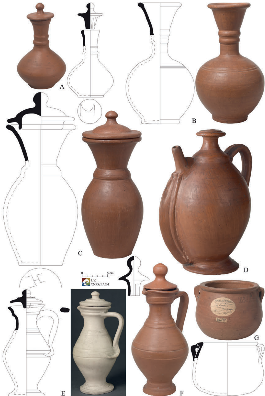
Figure 2. Manufacture et musée nationaux, Sèvres, collections datées de bouteilles, carafes, pichets et marmite ; A, G : 1835 achetées à Saint-Pierre, François-Auguste Perrinon ; B, C, D : 1843 Victor Schœlcher ; E, F : 1874 Charles-Marius-Albert Dompierre D'Hornoy, Exposition permanente de l'Algérie et des colonies.