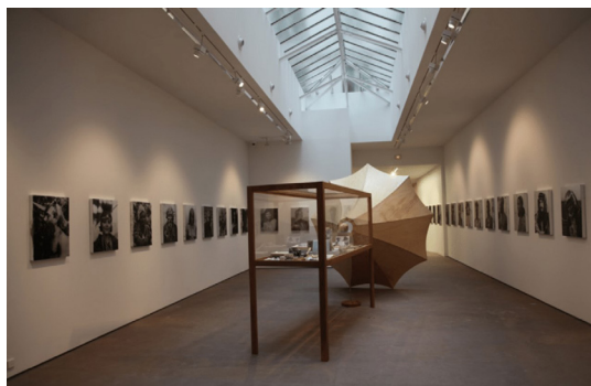
PHOTO 5. – Anatomie de la mémoire du corps : au-delà de la Tasmanie , Brook Andrew, vue d'installation, galerie Nathalie Obadia, Paris, 2013

Le visage en plâtre blanc d'Athéna avait été strié de lignes coulant de ses yeux recouverts de peinture noire