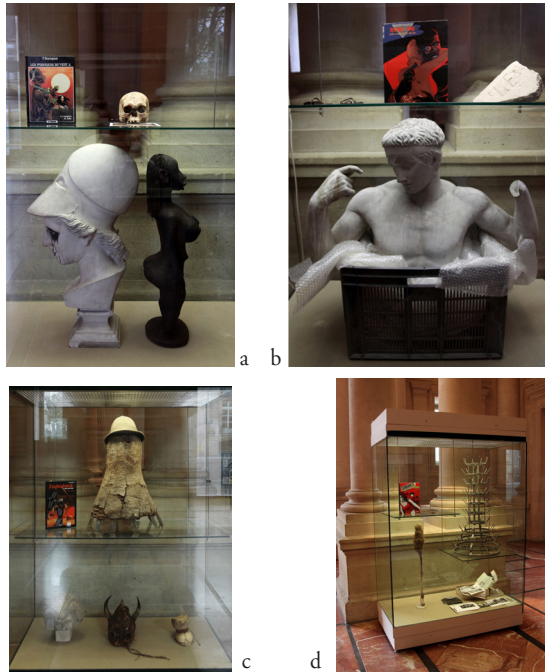
PHOTOS 4. – Forgotten Trophies , Brook Andrew, musée d'Aquitaine, 2013 : a vitrine 1 ; b : vitrine 2 ; c : vitrin 3, d : vitrine 4 (clichés Andrew)

En 2013, Brook Andrew fut invité en résidence d'artiste à Bordeaux par le musée d'Aquitaine, dans le cadre de l'exposition Mémoires vives. Une histoire de l'art aborigène (Vivid Memories. An Aboriginal Art History) sous le commissariat d'Arnaud Morvan et