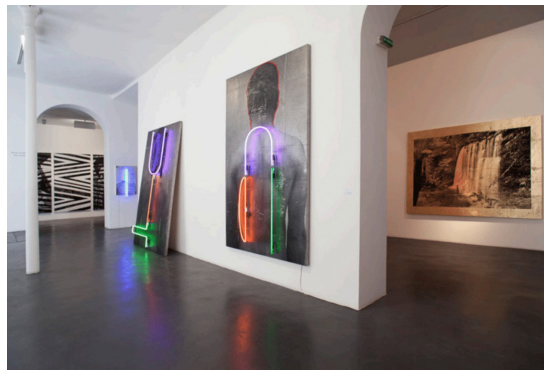
PHOTO 7. – Vue de l'exposition The Forest , galerie Nathalie Obadia, Paris, 2016

Bien que gardant une dimension cryptique, The back of a man pourrait faire référence au procédé d'enregistrement du corps dans les photographies ethnographiques ou la phrénologie. Les gens étaient photographiés de face, de profil et de dos dans le but de leur assigner un type racial en utilisant des instruments de mesures (phrénologie) ressemblant à la forme décrite par les néons (qui enserrant le corps ou la tête des personnages). Les gens étaient en quelque sorte déshumanisés pour être catégorisés et classifiés : placés dans une hiérarchie de la même manière qu'un naturaliste le ferait avec des espèces naturelles. Dans ce processus, l'identité de la personne photographiée a été effacée, elle est devenue un spécimen, un corps souvent condamné au processus de marchandisation. Partout dans le monde, des individus de peuples autochtones furent emmenés loin de leurs terres, puis vendus pour travailler dans les cirques et les zoos humains. L'usage que fait Andrew du néon est celui d'un marqueur contemporain qui connecte différentes temporalités mais c'est aussi un signe de la marchandise capitaliste,