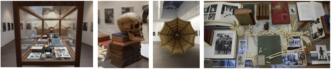
PHOTOS 6 (a, b, c, d). – Anatomie de la mémoire du corps : au-delà de la Tasmanie , détails, Brook Andrew, Galerie Nathalie Obadia, Paris, 2013

historiques et biographiques émergent de ces associations aléatoires dans cette œuvre que l'on pourrait qualifier d'assemblage transmémoriel. L'effet visuel de ces croisements de regards, très présent dans le travail d'Andrew, matérialise l'idée de créer des liens entre les histoires. Cette dimension fut accentuée pendant le vernissage de l'exposition, avec la performance de la compositrice britannique d'origine rwandaise, Stéphanie Kabanyana Kanyandekwe, du morceau musical Illusions on Self Motion , spécialement commandité par Andrew.