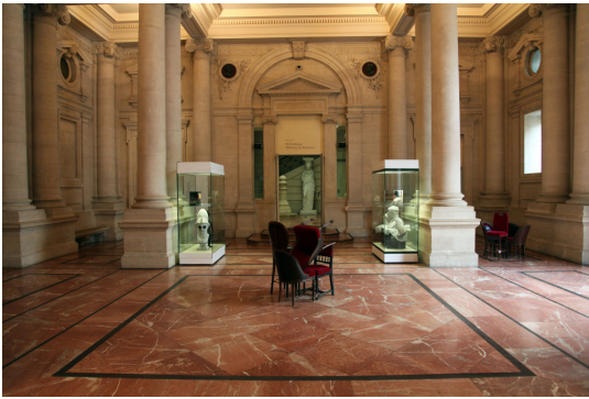
PHOTO 3. – Forgotten Trophies , Brook Andrew, vue d'installation, musée d'Aquitaine, 2013 (cliché Andrew)

de l'ordre du tectonique, du violent et du politique.» (Richard, 2017)