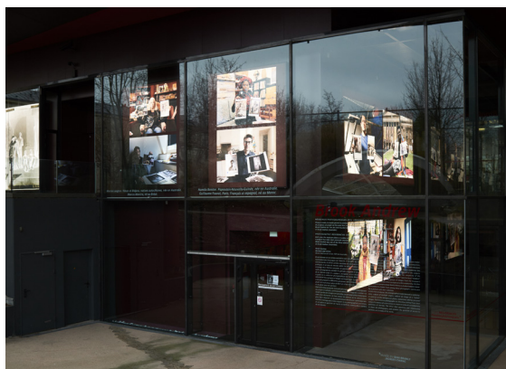
PHOTO 1. – Resident and Visitor , Brook Andrew, vue d'ensemble, MQB-JC, 2016