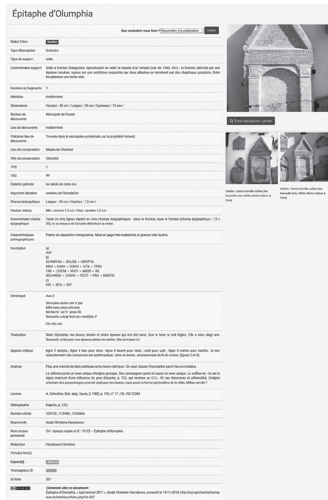
Fig. 2. Fiche descriptive de la stèle d'Olumphia, CIL VIII, 21284.

Avec l'inscription comme unité documentaire, la base présente les champs classiques de la description matérielle du support et de l'étude du texte (Fig. 2). Le corpus épigraphique s'appuie sur une riche documentation photographique qui a pu être numérisée et qui est conservée à la photothèque du CCJ ( http://photoarcheomed.mms.h.univ-aix.fr ) (6). Certaines notices sont en lien avec des documents d'archives disponibles dans AreAr (Archives et Archéologie au Centre Camille Jullian) (7).