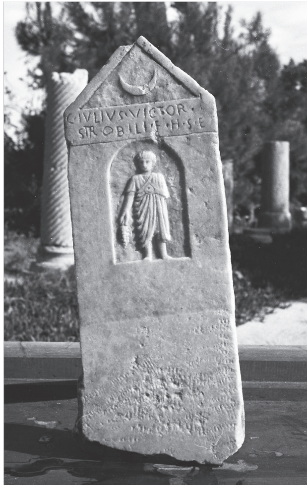
Fig. 1. Épitaphe de Caius Iulius Victor , fils de Strobilus , AE 1985, 928.

contribuer à la formation de jeunes chercheurs algériens et français en épigraphie et en numérique (5).