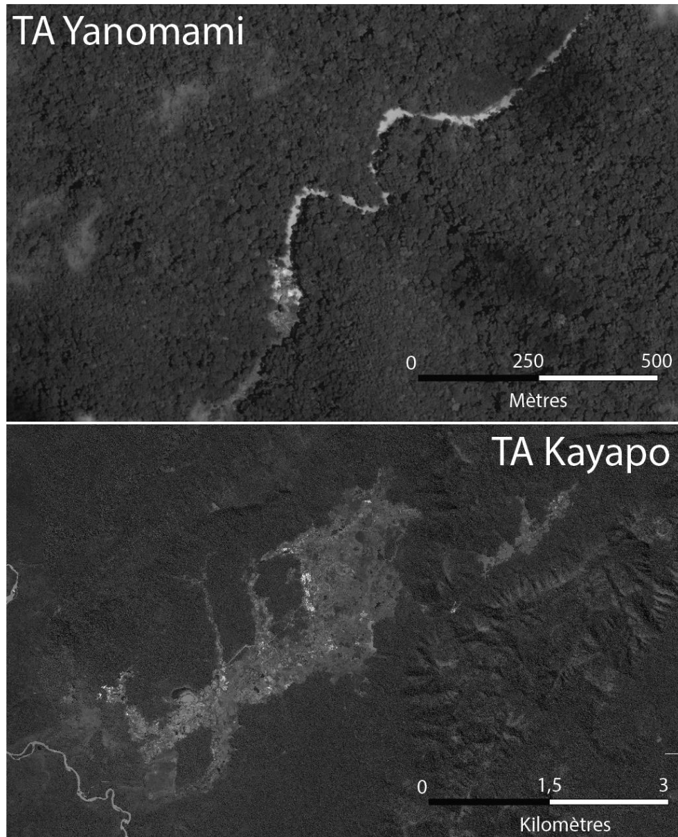
Figure 2 : bien qu'en principe protégés, les TA sont facilement envahis par les garimpeiros, qui y installent des petits chantiers ou bien des opérations de grande ampleur. Dans la figure du haut, dans le TA Yanomami,

La violence à l'encontre des populations amérindiennes n'est pas seulement faite d'événements ponctuels, aussi tragiques soient-ils, mais elle est aussi le reflet d'un système dans lequel les dirigeants politiques, de droite comme de gauche, ont tendance à considérer les demandes foncières des Amérindiens comme illégitimes (de Carvalho, Goyes et Vegh Weiss (2020). Le gouvernement de Dilma Rouseff a ainsi initié la décennie de quasi-stagnation de reconnaissance des TA, alors que le gouvernement Bolsonaro a ajouté à cette situation de blocage un discours ouvertement anti-amérindien.