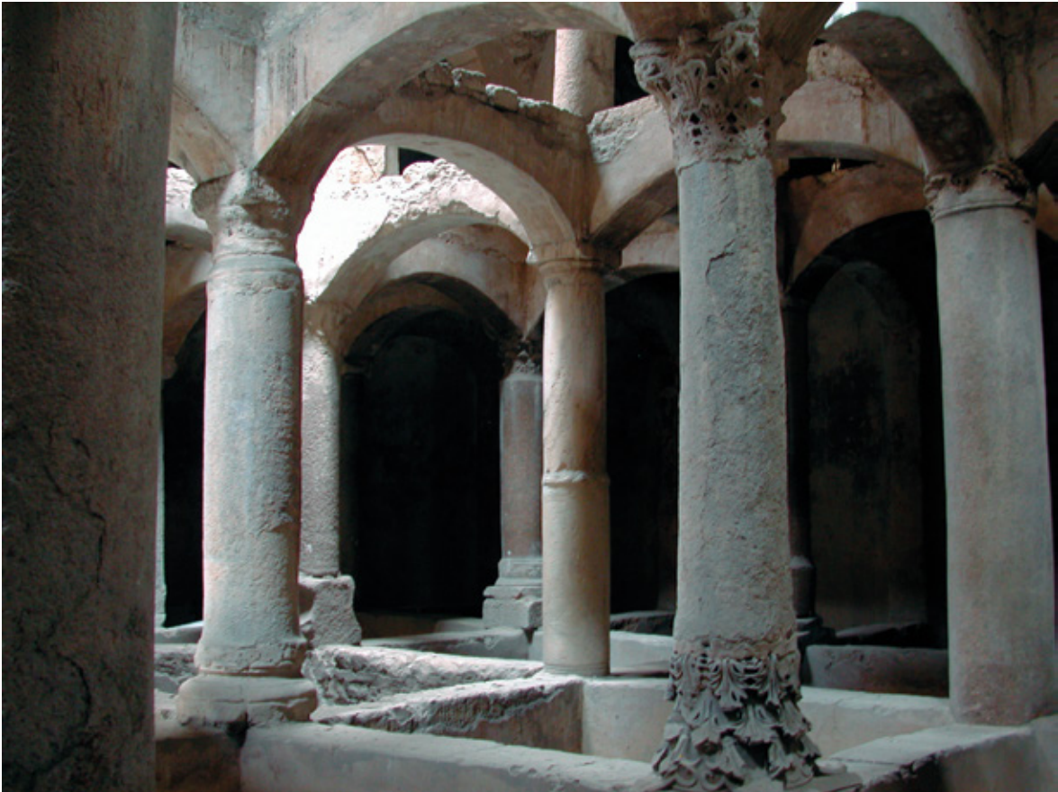
Figure 7 : Vue générale de l'intérieur du réservoir de la citerne au niveau des points d'appui intermédiaires.

Classée en 1898 11 , comme « monument arabe à conserver », par le Comité de conservation des monuments de l'art arabe, la citerne el-Nabih est située dans l'angle sud-est du jardin Nubar pacha. Ce jardin a été aménagé au début du xx e siècle sur l'emprise d'un tronçon de la muraille médiévale au moment de son démantèlement. Le volume intérieur du réservoir peut être, encore aujourd'hui, observé depuis une baie aménagée en 1900 12 dans la partie supérieure du mur périmétral est (fig. 7). On accède à cette baie en empruntant un escalier contemporain à celle-ci.