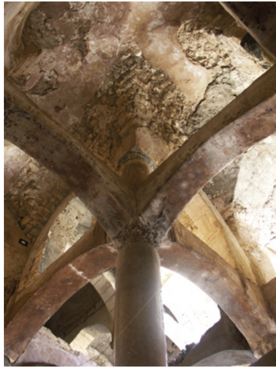
Figure 10 : Vue en contre-plongée, depuis l'angle sud-ouest du réservoir, du système de contreventement et de la partie du couverture constitué de voûtes d'arêtes.