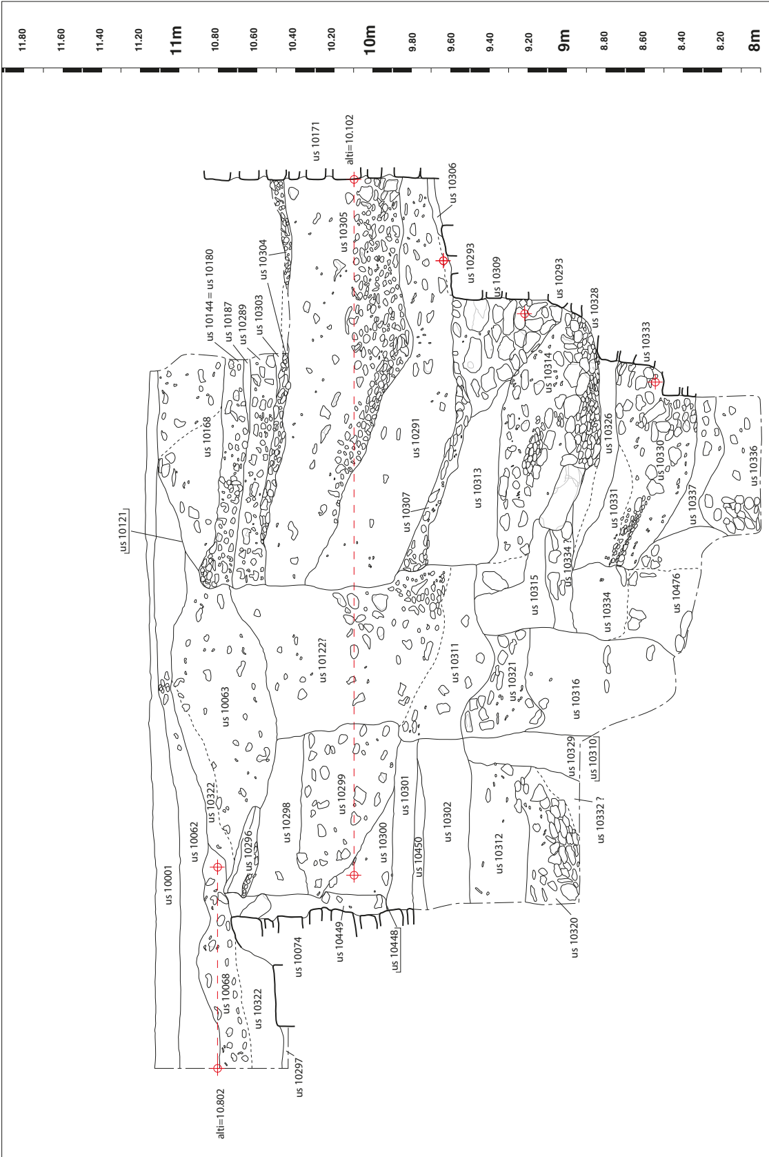
Figure 6 : Coupe stratigraphique de la paroi nord-ouest du sondage extérieur ouest. Levé et dessin S. Desoutter