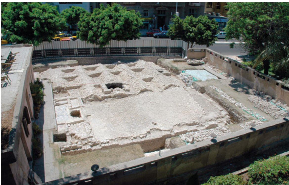
8 Figure 3 : Vue générale du pavement des voûtes d'arêtes et de l'extrados des voûtes en berceau de la citerne à l'issue de la campagne de fouille en 2007.