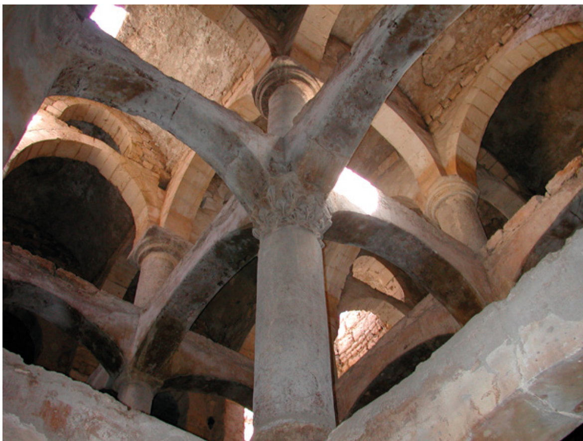
Figure 11 : Vue en contre-plongée, depuis l'angle sud-ouest du réservoir, du système de contreventement et de la partie du couvrement constitué de voûtes en plein cintre surhaussé.

La plus grande d'entre elles, de plan approximativement carré (1,50 m x 1,10 m) est située au milieu de la travée centrale. Il s'agit très certainement de l'orifice de puisage principal. Celui-ci devait être doté d'un système d'extraction mécanique dont aucune trace n'a été trouvée durant la fouille. Deux autres ouvertures zénithales, de moindres dimensions, sont situées dans l'angle sud-ouest du réservoir. Elles ont peut-être servi d'orifices de puisage secondaires pour des baraquements 14 installés à une période tardive comme l'attestent certaines planches des archives du service du ministère des Travaux publics, dit « dossier Kamil » 15 , du nom de l'un des ingénieurs qui participa à un inventaire initié en 1896 par le gouvernement égyptien et la municipalité d'Alexandrie. La citerne compte une dernière ouverture zénithale qui est accolée à l'angle nord-est du réservoir. De plan semi-circulaire, d'environ 0,95 m de diamètre, ce regard de visite était l'unique accès au niveau inférieur de la cuve. On y descend grâce à des petites cavités disposées en vis-à-vis dans ses parois verticales faisant office d'échelons. Il permettait d'assurer le curage des dépôts sédimentaires et l'entretien de la cuve.