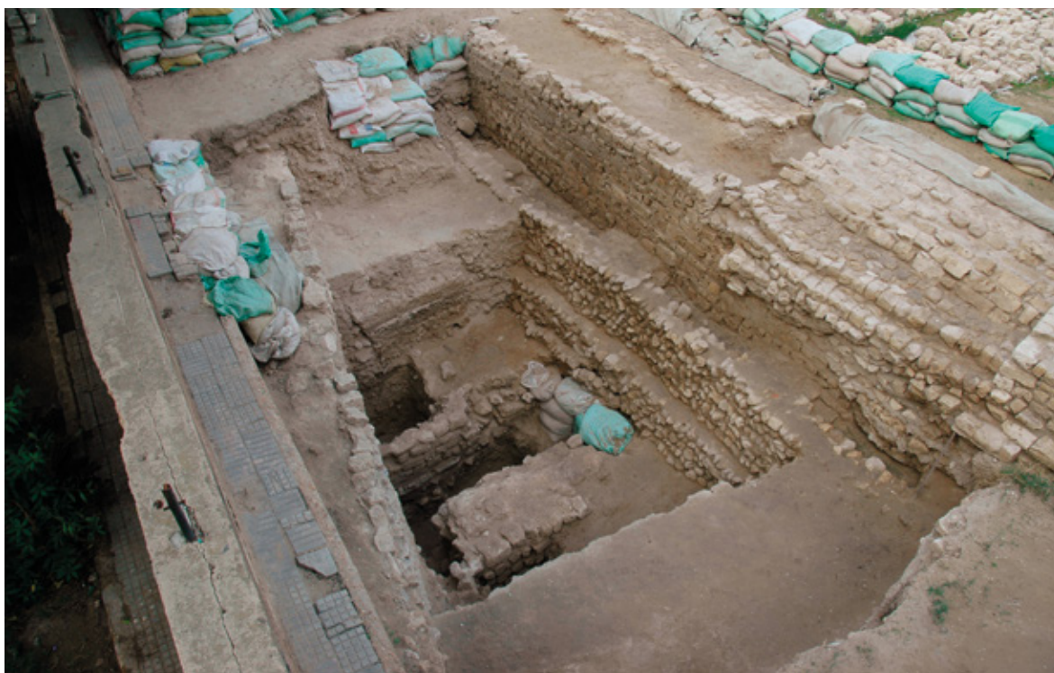
Figure 5 : Vue générale du sondage ouest à l'issue de la dernière campagne de fouille en 2009.