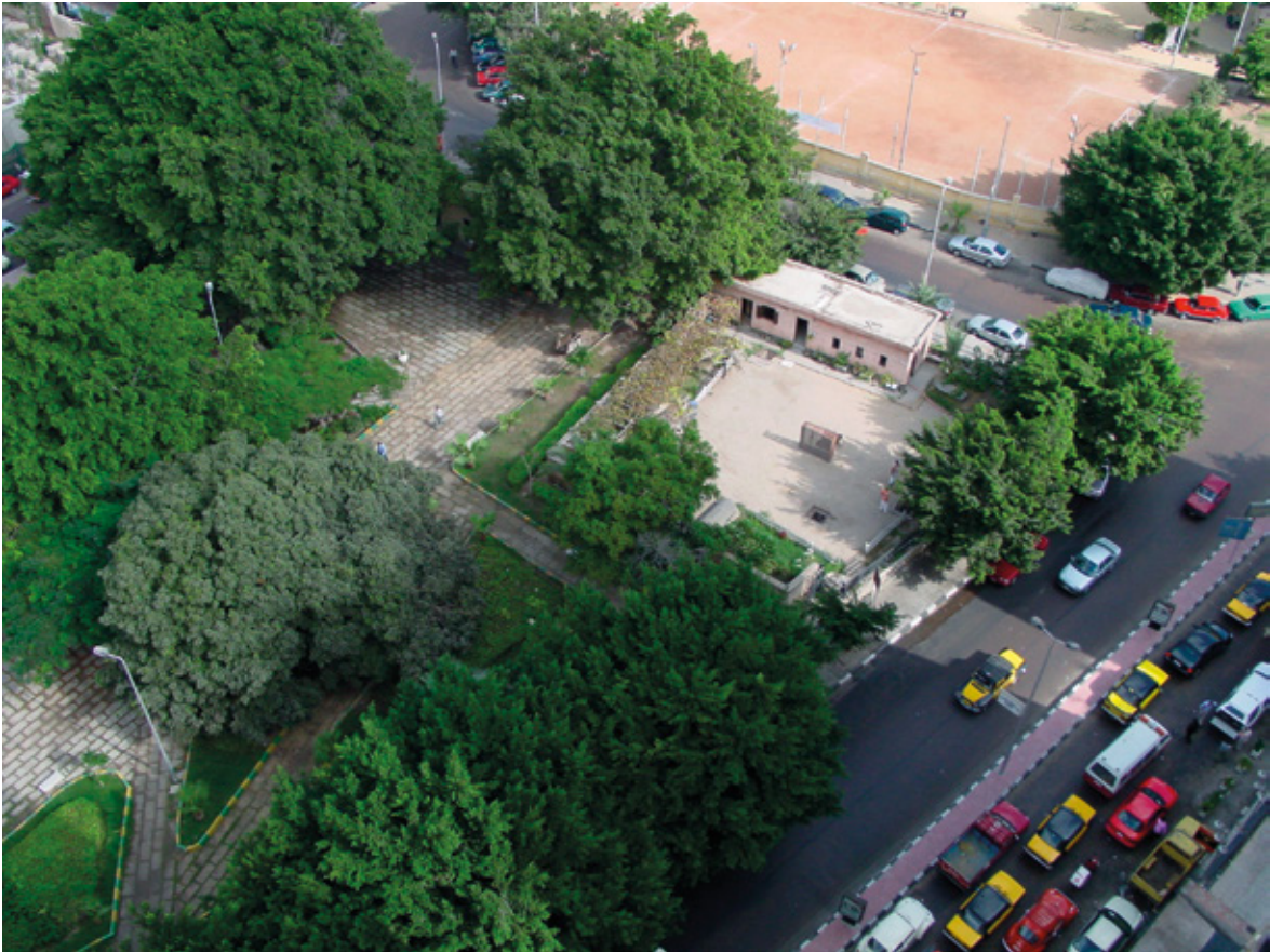
Figure 2 : Vue aérienne des abords de la citerne el-Nabih et de l'angle sud-est du jardin Nubar pacha en 2007.

ont d'abord portées sur les remblais de l'extrados des voûtes qui constituent le couvrement de la citerne, puis, quand cela était techniquement possible, sur les abords de celle-ci (fig. 3-4). La totalité du couvrement (pavement des voûtes d'arêtes, bâtiment à l'angle nord-ouest et extrados des voûtes en plein cintre surhaussé) ainsi que les parties sommitales des murs périmétraux, soit environ 230 m 2 , ont été intégralement fouillés. Deux sondages ponctuels, localisés à l'aplomb des points d'appui 305 et 313, ont été réalisés dans le remblaiement scellé par le pavement, après démontage de celui-ci. Dans les deux cas, le sondage a atteint l'extrados au niveau de la croisée de la naissance des voûtes d'arêtes, à 1,20 m environ sous le pavement de l' impluvium mis au jour. Un seul sondage profond en palier a pu être entrepris sur les abords de la citerne. Situé à l'ouest de celle-ci, le fond du sondage est à 3,57 m par rapport au niveau de circulation actuel sur le sommet de la citerne, soit la cote altimétrique 7,53 m du système général de nivellement d'Alexandrie (fig. 5-6).