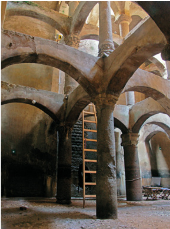
Figure 9 : Vue intérieure de l'angle nord-ouest du réservoir de la citerne avec les trois niveaux de son système de contreventement durant les opérations d'acquisition tridimensionnelle par lasergrammétrie en 2009.