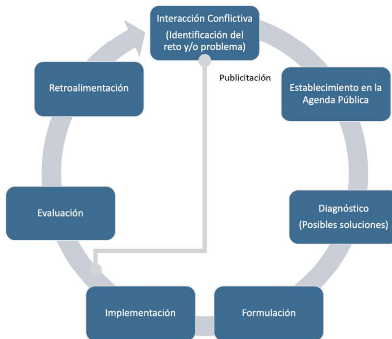
Figura 1. Etapas de Política Pública