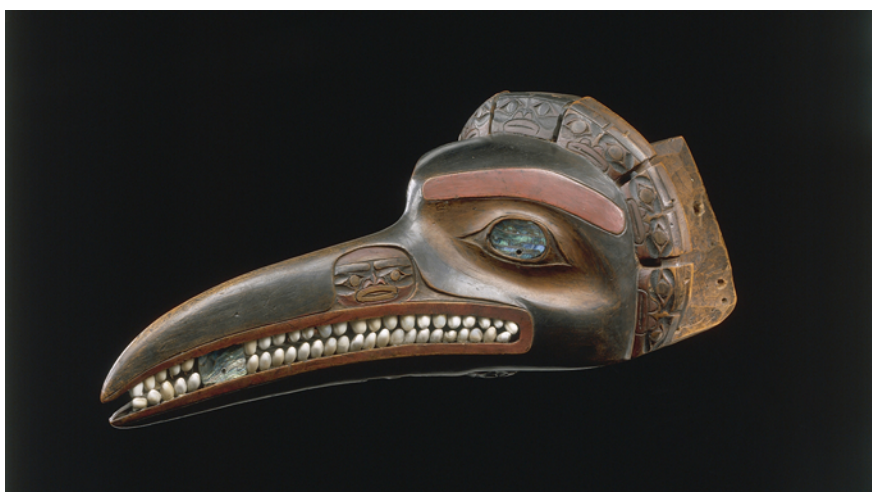
Figure 4 Parure frontale nisga'a représentant une libellule ou un moustique, collectée par George T. Emmons dans la région de la Nass inférieure (Colombie-Britannique). Les yeux de l'insecte sont incrustés de fragments de nacre d'haliotide ainsi que les mandibules. La bouche est armée de dents en opercules de coquillage. Le sommet du masque est entouré d'une frise de visages humains disposés en couronne

(Photo Edmund Schwinke. Burke Museum of Natural History and Culture, 1988-78/144. Source : https://www.aboriginalbc.com/events/land-head-hunters/ )