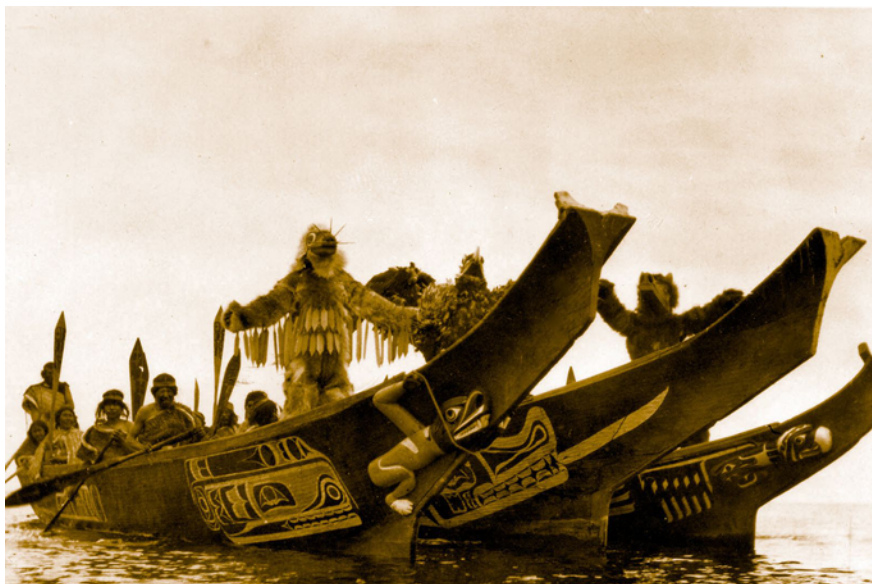
Figure 3 Un danseur à la proue d'un canot apparaît dans la danse Hamasalat (danse de la Guêpe), lors la cérémonie dite de la capture de la fiancée

(cliché du film In the Land of the Head-Hunters , Edward Curtis 1913 [1914])