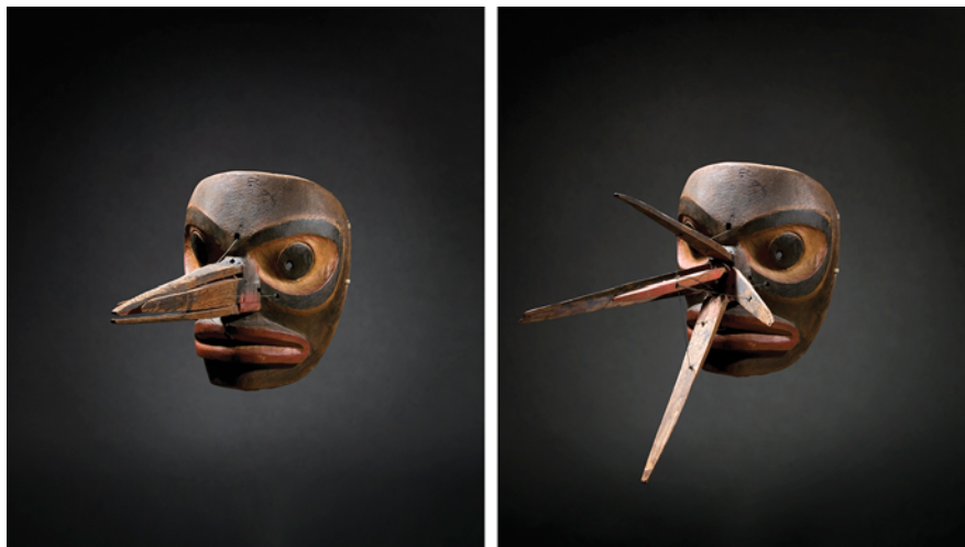
Figure 2 Ce masque moustique kwakwaka’wakw est doté d’un nez/trompe articulé qui, par un système de charnière et de ficelles, se déploie en quatre volets latéraux (Galerie Flak, Paris. University of Pennsylvania of Archeology and Anthropology, échangé à Julius Carlebach ; ancienne collection René d’Harnoncourt. Reproduit avec l’aimable autorisation d’Edith et Julien Flak)

On identifie deux danses associées aux insectes chez les Kwakwaka’wakw : la danse du Moustique et la danse de la Guêpe ou de l’Abeille, exécutées toutes les deux lors des cérémonies d’hiver (éca), dans le cadre du rituel cannibale (hamaça) dominé par la figure de Baxbakwalanuksiwe, prédateur anthropophage. À la suite de leur rencontre avec l’esprit, durant une retraite secrète, les initiés sont contaminés par cet esprit et sont mus par un désir insatiable de manger de la chair humaine. Lors de la séquence du rituel qui marque leur retour, ils agressent les non-initiés en les mordant au bras, puis ils sont pacifiés, notamment par des chants. L’initié est perçu comme la proie de Baxbakwalanuksiwe et comme un prédateur pour les non-initiés. Le droit d’exhiber la danse du Moustique est un droit associé à un nom rituel ; elle appartient à un nombre très limité de familles 8 . Intervenant après l’initiation du jeune danseur hamaça, elle ne figure pas parmi les danses les plus prestigieuses dans le rituel cannibale. Lors de la cérémonie, le danseur masqué se