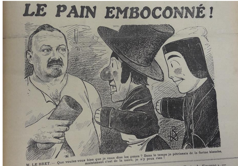
Fig. 4 : « Le pain emboconné », dessin de L. Bonnard, Guignol , 11 août 1917, p. 1