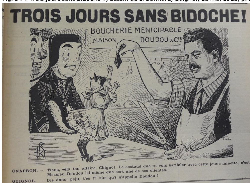
Fig. 5 : « Trois jours sans bidoche », dessin de L. Bonnard, Guignol , 18 mai 1918, p. 1

Et le succès est réel, y compris aux yeux d'un Guignol pourtant plus proche du socialisme que du radicalisme et qui a à plusieurs reprises appelé à des politiques d'intervention directe et de réquisition. Dans le numéro du 18 mai 1918, alors que la ville est frappée par une pénurie de viande, Herriot est qualifié de « bête noire des spéculateurs et des commerçants dénués de scrupules » :