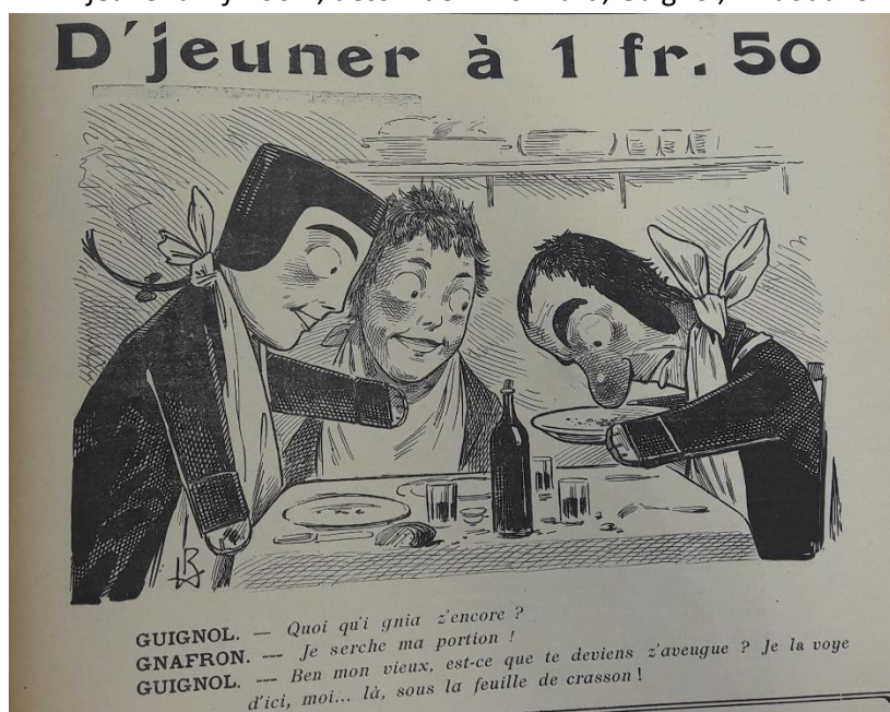
Fig. 2 : « D'jeuner à 1 fr. 50 », dessin de L. Bonnard, Guignol , 14 août 1915, p. 1

Dans l'ensemble, ces mesures semblent rencontrer un franc succès. Le colonel Obrecht, directeur de l'atelier de construction de Puteaux, cite ainsi les restaurants pour mères nourrices et les cuisines municipales de Lyon en exemple dans un rapport de mars 1917 sur l'organisation des cantonnements et restaurants ouvriers 12 . Localement, Herriot lui-même se rend dans le restaurant des Cuisines municipales du Ve arrondissement de Lyon début 1916 pour y recueillir l'avis des clients et se félicite : « tous mes clients, écrit-il, ont reconnu que la cuisine municipale leur épargnait à la fois beaucoup de temps et un peu d'argent ». Tout juste certains déplorent-ils la taille des portions ou la consistance du bouillon, très clair 13 . On retrouve les mêmes critiques dans le journal Guignol , qui moque en une de son numéro du 14 août 1915 un « D'jeuner à 1 fr. 50 » 14 (Fig. 2) qu'on suppose être celui des cuisines municipales et où la portion de viande est tellement petite qu'elle est dissimulée par une feuille de cresson.