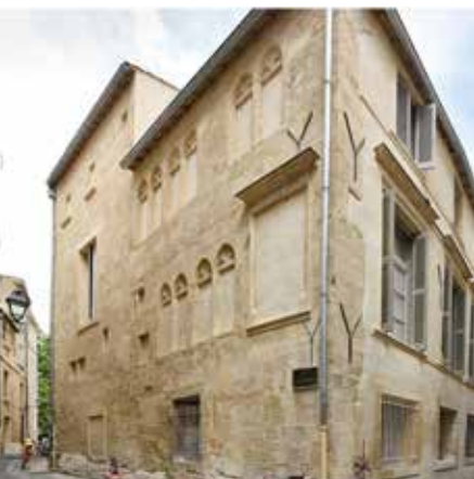
Rue du Vestiaire. Maison de la seconde moitié du 13 e siècle, probable vestiaire du chapitre Saint-Firmin.