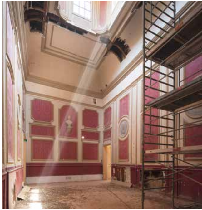
Le vestibule évoqué par le prix-fait de 1676.

ces fenêtres, des baies de combles plus petites sont aussi percées. L'entrepreneur s'engage également à ouvrir les portes des chambres sur un « salon en ovale ou vestibulle » qui correspond au vaste salon à l'italienne, prenant jour par une lanterne zénithale. La structure actuelle de la lanterne, probablement plusieurs fois refaite depuis le 17 e siècle, conserve sans doute sa forme d'origine.