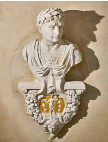
Escalier monumental. Détail d'un des bustes des Césars.