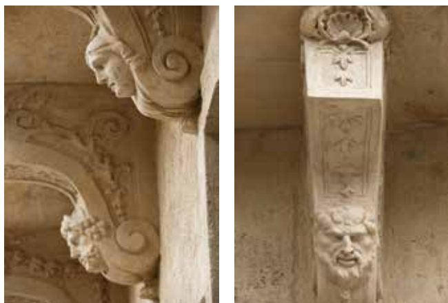
Consoles supportant l'extension du balcon, fin du 17 e siècle.