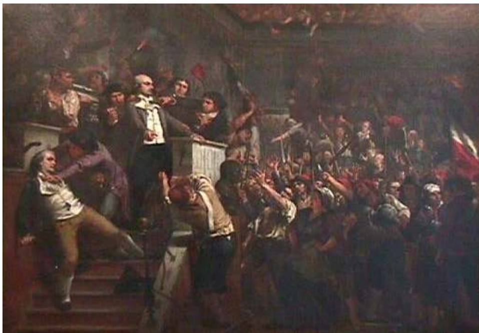
Charles-Louis-Lucien Muller, « Lanjuinais à la tribune de la Convention nationale » (1868, huile sur toile), https://commons.wikimedia.org/wiki/File:Muller_-_Lanjuinais_%C3%A0_la_tribune_de_la_Convention.jpg