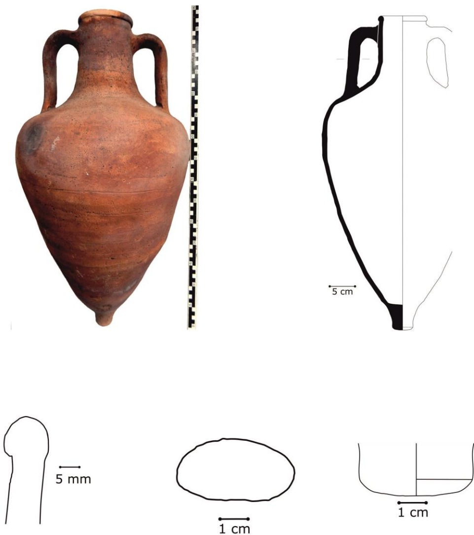
Fig. 3 - L'amphore inv. 45985.