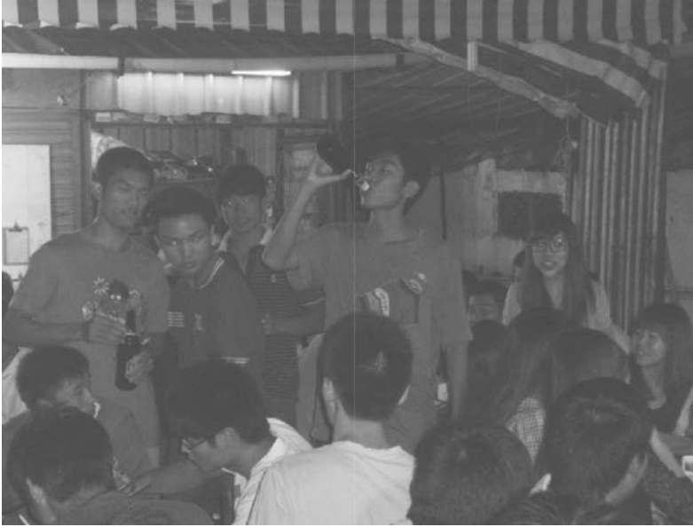
octobre 2011.

Dans le village de Nanting , une économie singulière et spatialisée est facilement identifiable et matérialisée. À proximité de l'université des beaux-arts de Canton, une vingtaine de petites échoppes de pinceaux, encadrement, dessins sont disséminées dans une des artères du village. Ces économies de niche, très spécialisées, sont liées aux conjonctures locales et aux effets d'aubaine – en matière d'opportunité d'emplois – perçus par les migrants.