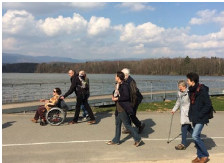
Balade du 17 mars 2017, photo du blog ▼