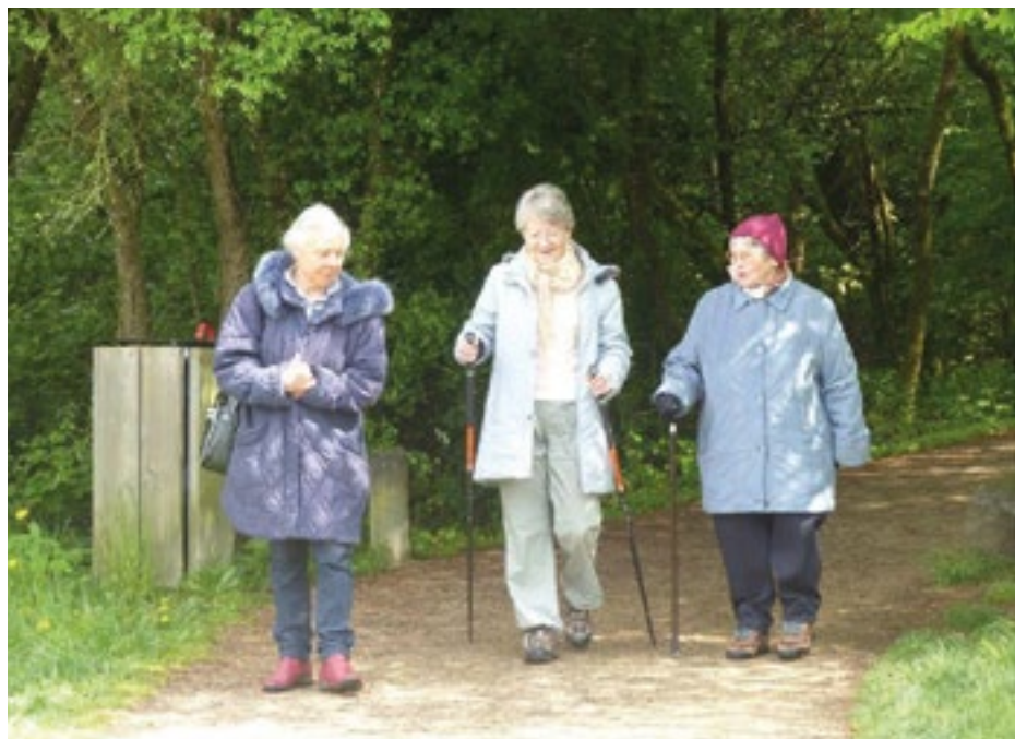
▲ Balade du 10 mai 2016