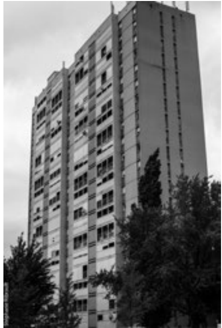
▲ 1 rue de Madrid

Françoise, lors d’un atelier d’écriture “confiné”, suggère également ce contraste, ou ce mélange qui caractérise le quartier, mélange de précarité, d’investissement de certains, de vie sociale. Elle mentionne également la centralité de certains lieux, notamment cette tour de Madrid, qui de ses 19 étages, surplombe non seulement le quartier, mais la ville et offre, depuis son dernier étage, un panorama époustoufflant sur le lion de Belfort et ses environs.