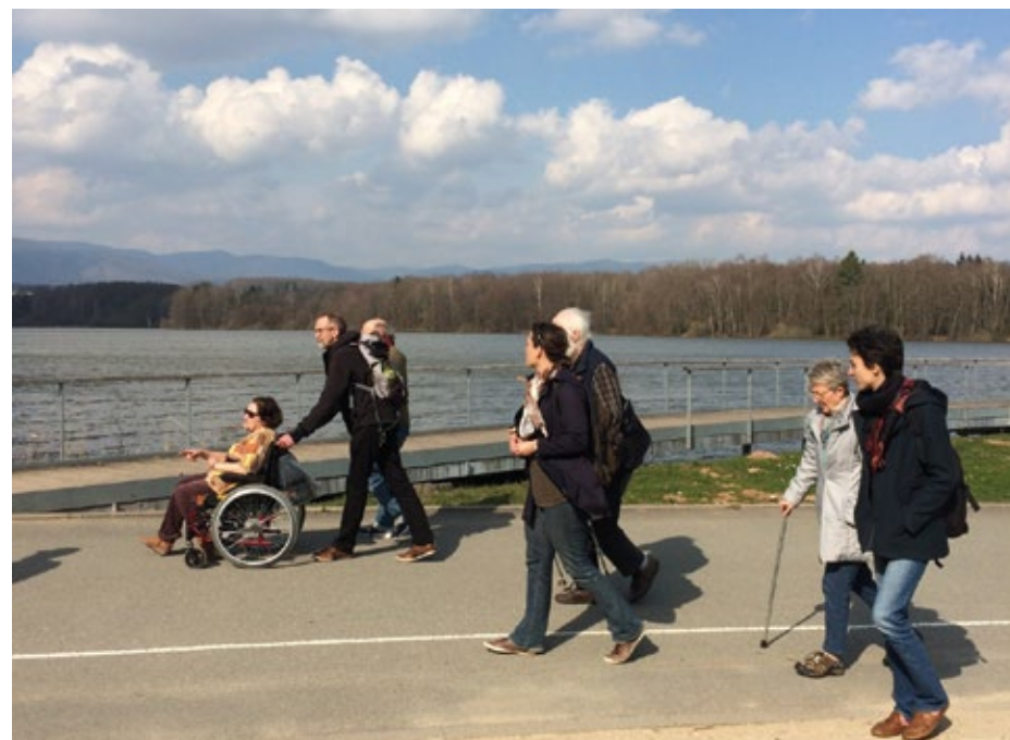
Balade du 17 mars 2017, photo du blog ▼