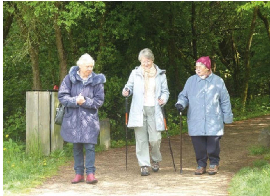
▲ Balade du 10 mai 2016, photo du blog

Marie-Anne, atelier d'écriture, avril 2018