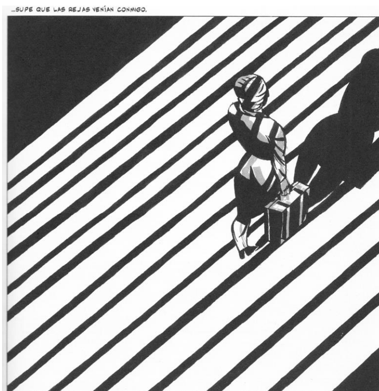
Fig. 12. “Entre rejas” (Cuerda de presas)

niños son numerosos, creando una especie de economía infantil de supervivencia. La presencia del frutero (“Fruta picada” en Paracuellos 2 ), que va un par de veces a la semana durante el recreo de la mañana, es esencial en la supervivencia de los niños, como podía serlo la presencia de un lugar en las cárceles en que se podía comprar unos alimentos. Antonio, el representante de Falange en el hogar, se da cuenta de la importancia de este “negocio” y prohíbe el paso al frutero para quedarse con su negocio. Monta un puesto de pipas, caramelos y otras chucherías: al no haber otro sitio adonde ir a gastar su escaso dinero, los niños compran en el puesto de Antonio. Es una especie de estraperlo legal, que existía en el franquismo bajo el nombre de “gran estraperlo” y que era tolerado por el régimen 42 .