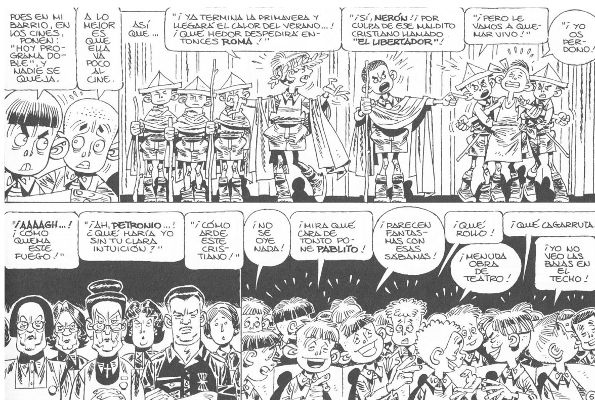
Fig. 13. “Teatro” ( Paracuellos 3 )

los niños identificarse con sus personajes preferidos y así, imaginando, dejan de pensar en todos los males que sufren. En “ El Cachorro, el catecismo y la señorita de Castellón ” ( Paracuellos 2 ), el cómic El Cachorro está presente en todas las mentes: los personajes de cómic son como personajes reales (“Pablito hablaba de El Cachorro con la misma familiaridad que si se tratase de una persona de la vida real”) hasta tal punto que los niños hablan de “jugar al cachorro”. Esta importancia de los cómics permite a Giménez rendir un breve homenaje a los autores de cómics en la posguerra 46 . En efecto, como él hizo de niño, muchos hicieron cómics para sobrevivir y poder mantener a su familia: Enrique Montero en El artefacto perverso representa paradigmáticamente esta situación porque tuvo que dejar su oficio de profesor para hacer tebeos acordes con el régimen. En “Fruta picada” ( Paracuellos 2 ), se evoca la posibilidad de ganar 25 pesetas si se manda un dibujo de Jaimito (personaje del dibujante Karpa). Yáñez mandó un cuento a El Coyote y se lo premiaron con 50 pesetas y la publicación del cuento. Giménez hizo dibujos a tinta china negra de “Jaimito en la playa”, “Jaimito futbolista”, “Jaimito amoroso”, y unos episodios fueron publicados.