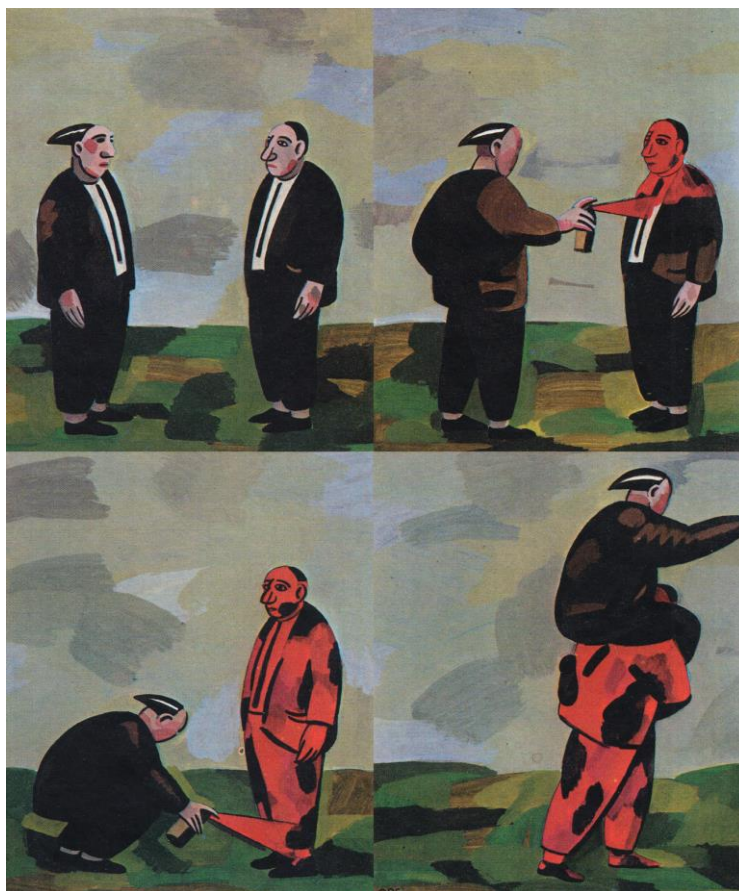
Fig. 5. O'Galsky, “La Guerra Civil”

ha esforzado en calificar a la otra como ‘roja’ para dominarla mejor” 20 . Las guardadoras hacen perder la identidad a los vencidos, para que puedan “habitar sin conflicto en la dictadura” 21 .