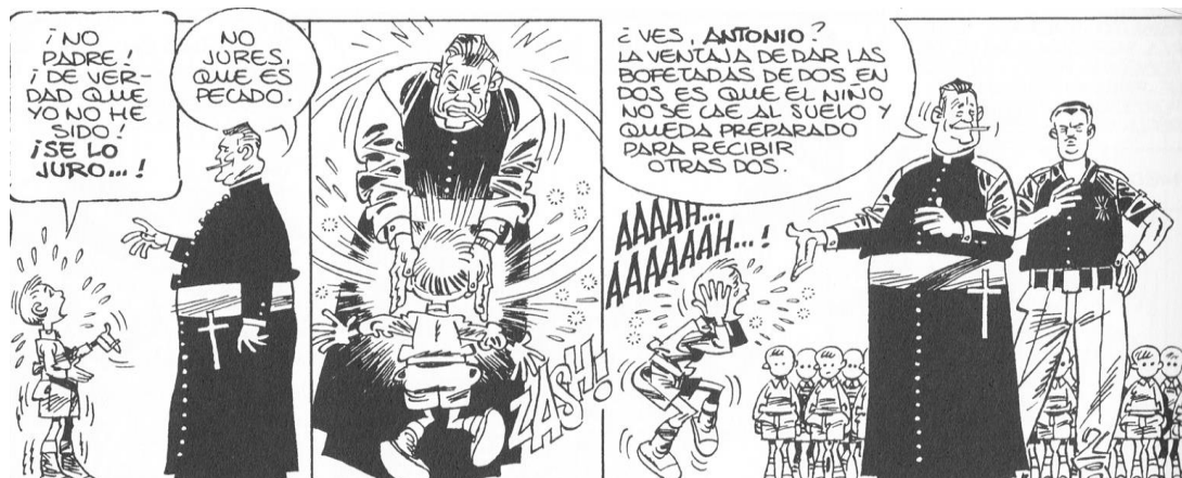
Fig. 10. “Cartas” ( Paracuellos 3 )

hacer sonreír o, por lo menos, esbozar una sonrisa en el lector en aquel ámbito represivo.