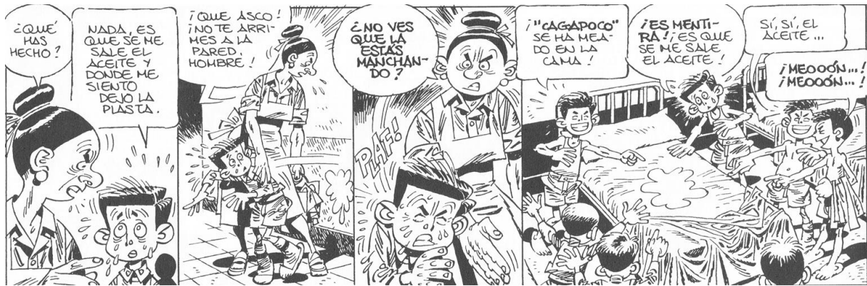
Fig. 9. “Cagapoco” ( Paracuellos 3 )

tonalidad trágica de la situación de los niños como víctimas. Hay algo que se acerca a lo inefable en el trazo de Giménez: para hacernos aceptar esta visión insoportable, el autor recurre a lo sublime entendido en el sentido de Kant 33 . En otras palabras, Giménez desea que no sepamos cómo reaccionar frente a una situación que suscita a la vez lo cómico y lo trágico: no sabemos si debemos llorar o reír, de modo que experimentamos las dos sensaciones juntas y después descubrimos lo que se puede denominar la verdad de lo subjetivo o la verdad de la emoción.