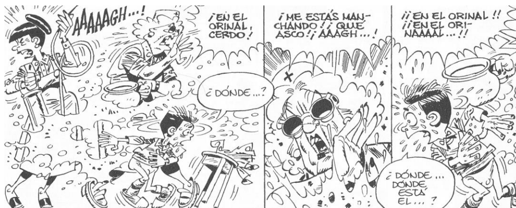
Fig. 2. “Cagapoco” ( Paracuellos 3 )

En cuanto a la violencia física, además de los golpes ya evocados, se añaden el hambre y la sed, necesidades vitales que los niños no pueden satisfacer por estar privados voluntariamente de ellas por parte de las guardadoras 5 . Esas realidades históricas son tanto más patentes en la lectura cuanto que Giménez las representa mediante “imágenes semantizadas” 6 , es decir, imágenes que tienen un impacto emocional muy fuerte. Pensamos en Toñín, apodado “Cagapoco” ( Paracuellos 3 ), quien, desde su llegada al hogar, no ha podido defecar y le duele la barriga. Las enfermeras escogen darle “agua con jabón” con una perfusión en los glúteos para “suavizar y dejar el intestino lubricado”. La otra enfermera tiene miedo de que el líquido no entre y el niño reviente. Siguen con la perfusión, pero la ventosidad sale, manchando a las enfermeras.