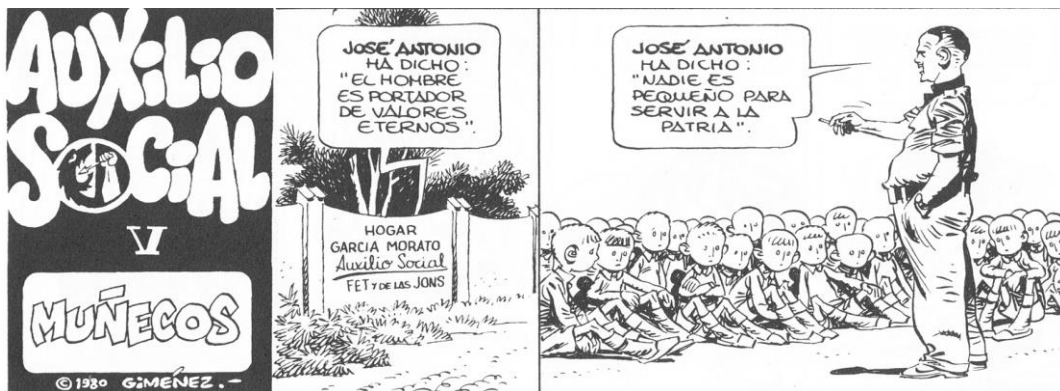
Fig. 6. “Muñecos” ( Paracuellos 2 )

Acerca de los niños, recordemos el episodio “Los impuros” ( Paracuellos 1 ), en el que Elías y el Moratalla duermen juntos porque hicieron un banquete y se durmieron hablando de su pasado respectivo. Una guardadora llega y los ve acostados juntos: se espanta de pensar que puedan ser homosexuales, los insulta (“¡Qué asquerosidad!