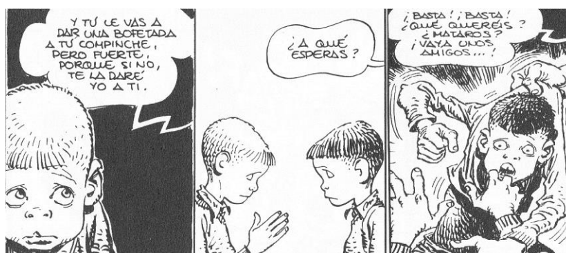
Fig. 1. “1953” ( Paracuellos 1 )