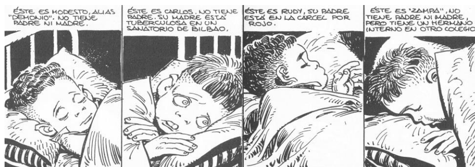
Fig. 4. “Noche de Reyes” ( Paracuellos 1 )