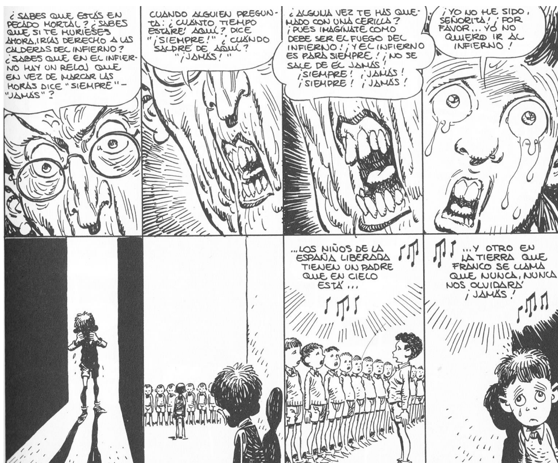
Fig. 8. “Los impuros” (Paracuellos 1)

obligándolas a “ingerir aceite de ricino para que sus efectos laxantes fueran vistos en público. La consiguiente humillación era el objetivo, acompañada de la mofa sobre lo ocurrido” 30 .