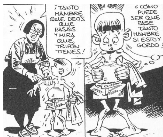
Fig. 3. “Piscurros” ( Paracuellos 3 )

La violencia moral que Giménez nos presenta es esencialmente doble: atañe a la falta de ternura y a la culpabilidad. La falta de ternura padecida por los niños es muy importante, pese al decreto sobre las nuevas normas de cuidado de niños promulgado el 17 de mayo de 1940, que animaba a la ternura para con los niños para su “desenvolvimiento físico y moral” 7 . En efecto, en aquel entonces cada mujer soltera de entre 17 y 35 años tenía que efectuar un servicio cívico de 6 meses, llamado el Servicio Social, como obligación impuesta por el régimen. Muchas escogieron los hogares del Auxilio Social para cumplir con este requisito, de ahí que las enfermeras o guardadoras a veces no tuvieran las competencias para cuidar a estos niños 8 . Las más jóvenes solían ser más buenas que las mayores, porque eran también víctimas de aquel engranaje 9 . El caso paradigmático es el de la señorita Merche (“El beso”), joven guardadora presente en el hogar como castigo, pero el caso de Antolín (“Domingo de visita”) merece ser mencionado. Un fotógrafo que venía, al principio, para hacer fotografías de las visitas para la propaganda franquista le tomó afecto a Antolín, después de que este huérfano le preguntara si podía sacarle una foto. En esa foto se ve al niño muy cerca del fotógrafo, casi apretándolo, lo que denota la falta cruel de ternura.