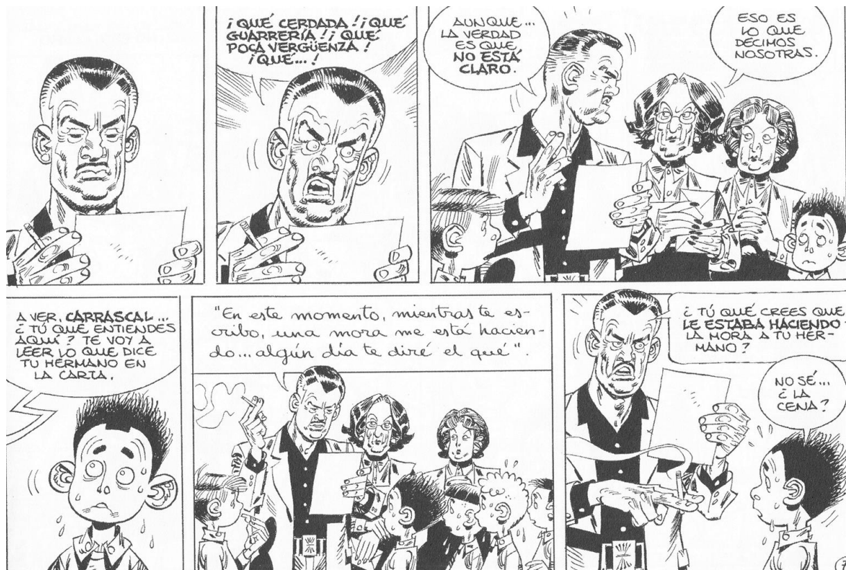
Fig. 7. “A Dios rogando” ( Paracuellos 5)

¡Obscenos! ¡Pervertidos!”), marcando su oposición frente a una orientación sexual concebida como desviada, y después lleva a cabo con la directora un interrogatorio culpabilizándolos y arguyendo que van a ir al infierno por culpa de semejante “pecado mortal”. La cara de diablo de la guardadora 28 recuerda las persecuciones, torturas y asesinatos frecuentemente cometidos en las cárceles y en la sociedad franquista por la “vuelta de tuerca en la valoración social de ciertos temas de índole moral o privada de las personas, como la homosexualidad, que volvió a ser condenada” 29 .