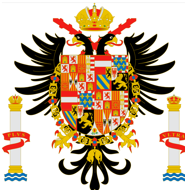
Armoiries de Charles Quint (dans une de leurs multiples versions).

Nous avons déjà évoqué le retournement qui s'est produit à l'égard de la limite, entre sagesse ancienne qui mettait en garde contre son franchissement, et tropisme moderne vers son dépassement. Le mythe d'Icare nous a servi d'illustration. Autre exemple emblématique : Hercule passait pour avoir inscrit, sur les colonnes qui portent son nom, l'avertissement : Nec plus ultra . Charles Quint, au début du XVI e siècle, prit pour devise : Plus ultra 14 .