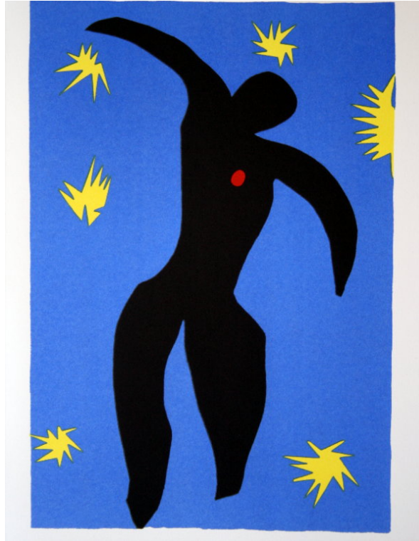
Henri MATISSE, Icare 1946, papiers gouachés, découpés et collés sur papier marouflé sur toile, 43,4 × 34,1 cm Paris, Musée national d'Art moderne