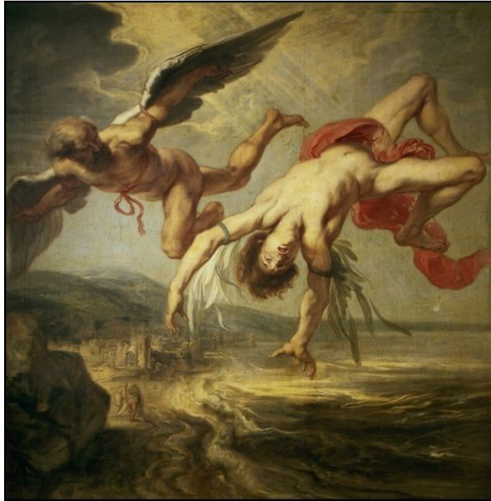
Jacob Peter GOWY, d'après un dessin de Peter Paul RUBENS, La Chute d'Icare vers 1636, huile sur toile, 195 × 180 cm, Madrid, Musée du Prado