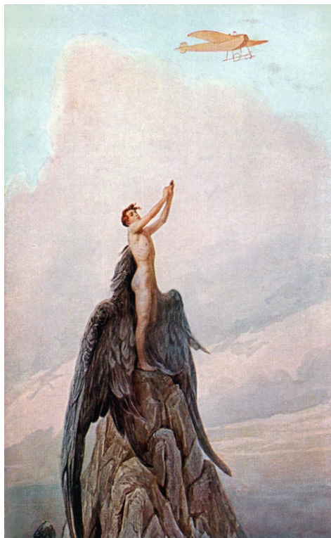
Sergueï SOLOMKO, Rêve d'Icare vers 1910, carte postale