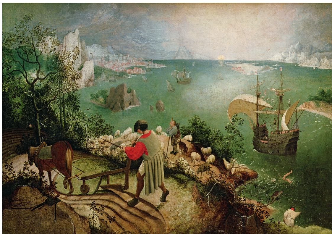
Copie d'un original perdu de Pieter BRUEGHEL l'Ancien, La Chute d'Icare , vers 1558 Huile sur bois transférée sur toile, 73,5 × 112 cm, Bruxelles, Musées royaux des Beaux-arts de Belgique

L'Europe prémoderne comprenait toujours le mythe de cette façon. En témoigne, au XVI e siècle encore, la peinture que l'histoire d'Icare inspira à Pieter Brueghel l'Ancien. Loin d'être la vedette du tableau, Icare se voit relégué dans la marge, et pourrait même passer inaperçu si le titre de l'œuvre n'invitait à déceler sa présence. D'Icare n'apparaissent plus, dans un coin, que ses jambes qui battent l'air, alors que le corps est déjà englouti par la mer. Au premier plan, un laboureur et un berger, plus loin un pêcheur et des marins : eux savent habiter la condition humaine.