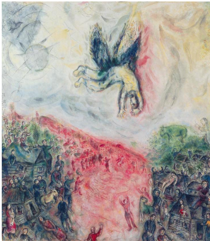
Marc CHAGALL, La Chute d'Icare 1975, huile sur toile, 213 × 198 cm, Paris, Musée national d'Art moderne