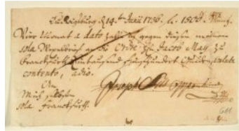
Letra de câmbio (PETER, 1789, p. 125)

E aqui outro exemplo, desta vez em letra de forma, de modelo de letra de câmbio retirada de um manual de finanças no século XVIII.