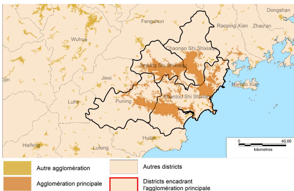
Carte 3 – Tache urbaine et découpages administratifs de la région de Shantou