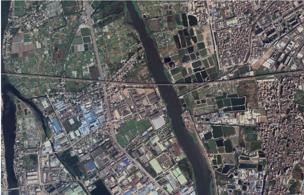
Image 1- Patchwork d'urbanisation et d'agriculture intensive dans l'agglomération du delta de Canton

Source : GoogleEarth (22.86N, 113.64E), Juin 2019