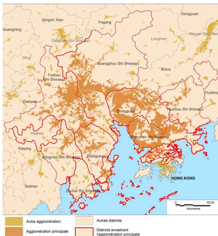
Carte 1 – Tache urbaine et découpages administratifs encadrant l'agglomération urbaine de Canton