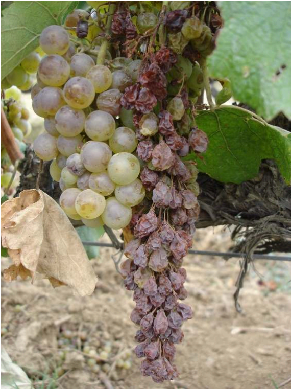
Illustration 1 : Raisins avec grains aszús