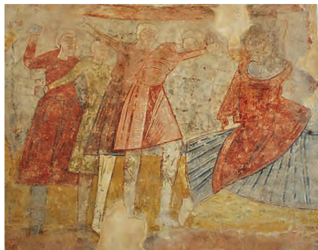
Fig. 26 – Marenyà, église Sant Esteve, Lapidation de saint Étienne.

La peinture catalane d'inspiration poitevine n'a malheureusement pas fait l'objet de la même attention que les autres. Plusieurs facteurs expliquent sans doute ce déséquilibre : la moitié des ensembles sont restés dans leur contexte et sont dès lors moins connus, les trois autres se trouvent dans des musées moins fréquentés que le MNAC, la plupart sont fragmentaires et souvent mal photographiés, les peintures d'Osormort sont très sombres et toutes sont considérées comme tardives et dépendantes d'une influence extérieure. Un détail des peintures de Canapost montre pourtant le talent de son auteur, notamment dans le tracé des rehauts blancs (fig. 25). Dans la Lapidation de saint Étienne peinte dans l'abside de Marenyà, les plis de la tunique