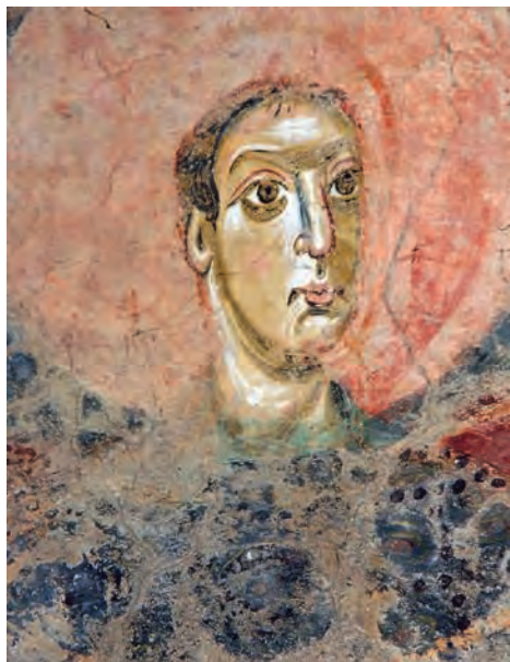
Fig. 7 – Galliano, église Saint-Vincent, saint Michel.