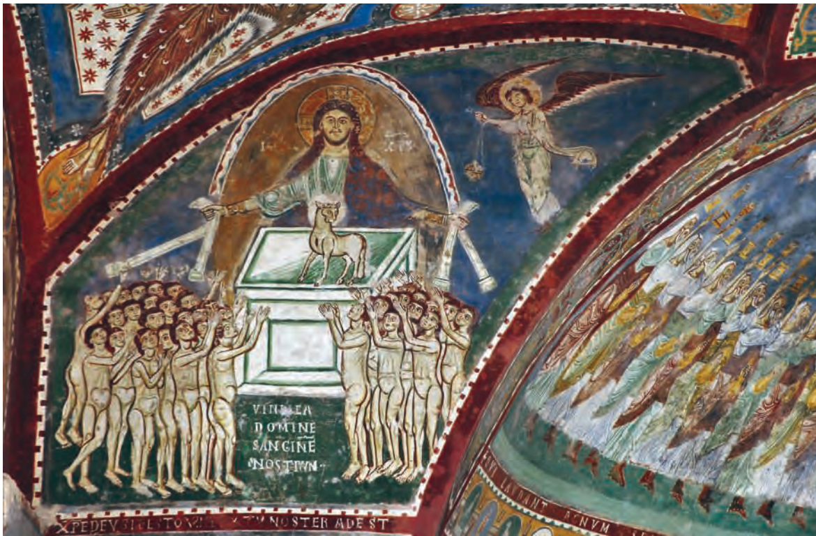
Fig. 18 – Anagni, crypte de la cathédrale, les martyrs sous l'autel encensé par l'ange d'Apocalypse 8 (cl. de l'auteur).

Depuis une vingtaine d'années, on a eu tendance à déplacer le centre de gravité des sources d'inspiration de la Lombardie à la moitié sud de la péninsule 64 . Ce point de vue se justifie par les différents points de contact entre les deux vastes corpus, comme le programme de Saint-Laurent-hors-les-Murs relevé plus haut, même s'il présente moins d'affinités que celui de Galliano. On a également invoqué les rouleaux d'Exultet où l' ecclesia a été représentée assise sur une église, comme dans l'absidiole méridionale de Pedret 65 . Et à ces exemples, on peut ajouter les donateurs de Santa Maria Antiqua, Santa Maria in via Lata, San Gabriele all'Appia et Saint-Clément de Rome également mentionnés plus haut au sujet de la figure de Lucia de la Marche offrant un cierge dans l'abside de Buralg (fig. 2).