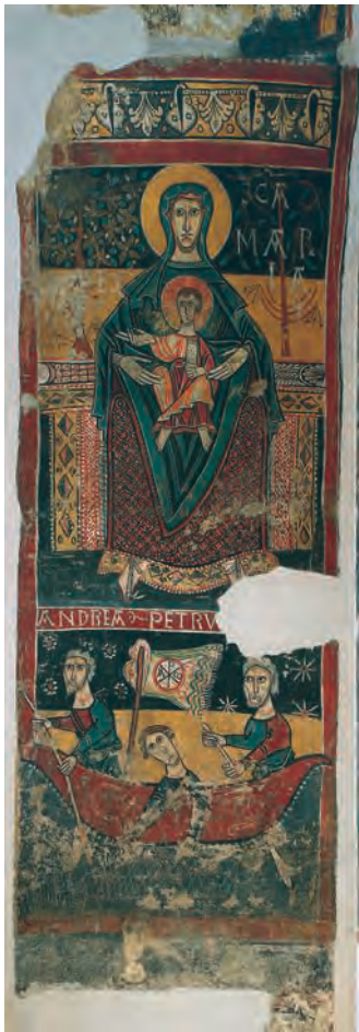
Fig. 22 – Sorpe, église Saint Pere, peintures de l’arc presbytéral déposées au MNAC, la Vierge à l’Enfant et la barque de saint Pierre (cl. du MNAC).

de l’eucharistie, l’opposition entre l’Ancienne et la Nouvelle Loi et le culte de saint Clément 80 . Et une polysémie comparable peut être envisagée pour les mosaïques de Sainte-Marie-du-Transtévère 81 .