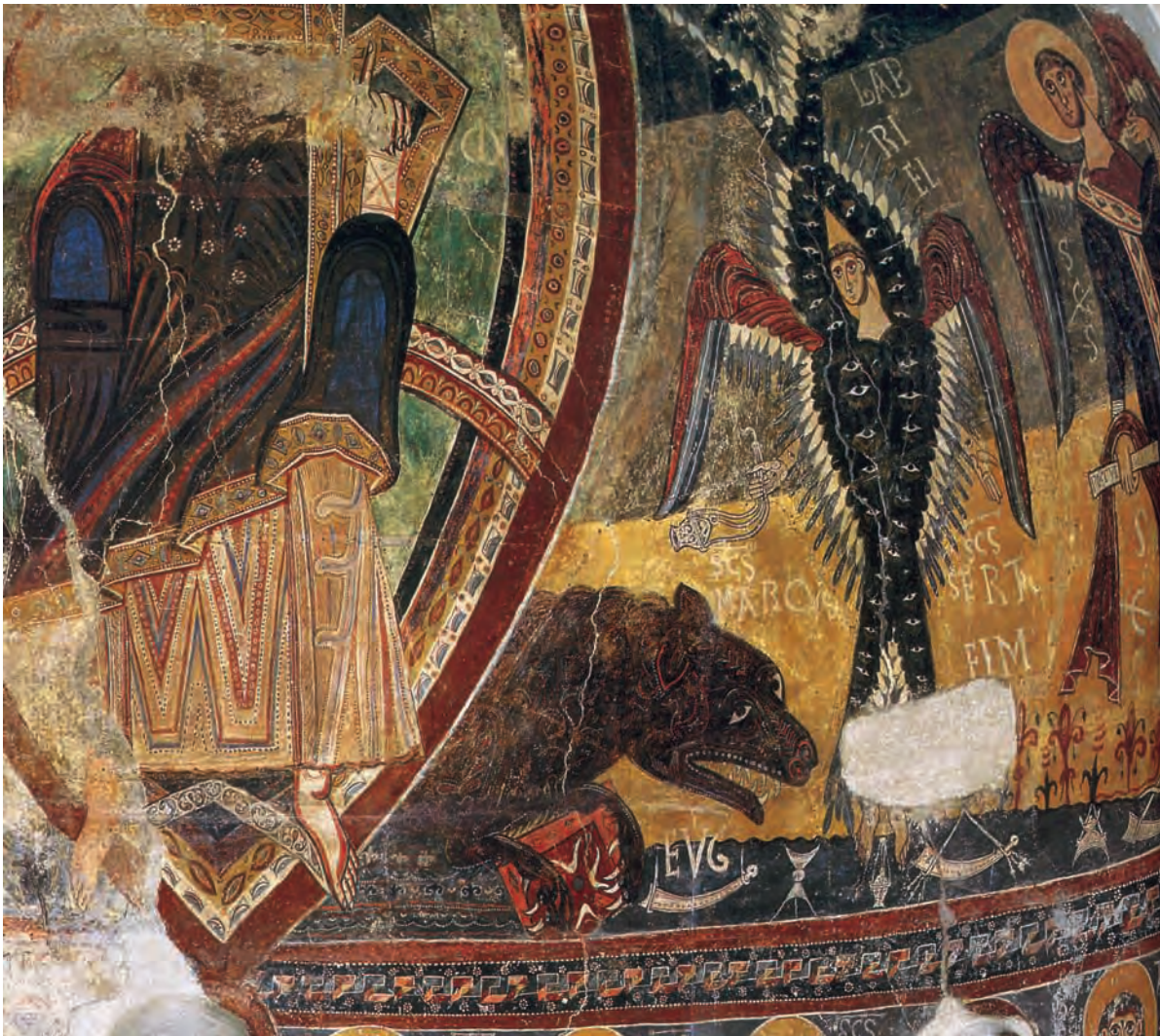
Fig. 27 – Sant Pau d'Esterrí de Cardós, peintures de l'abside déposées au MNAC, séraphin encensant des objets liturgiques.

dogme de la présence réelle qui s'est imposé dans la seconde moitié du XI e siècle, mais l'hypothèse est plus fragile 109 . De même, cette insistance sur la liturgie peut difficilement être rattachée à la réforme grégorienne, même si H. Toubert a soutenu ce type de lecture au sujet de la représentation de la messe de saint Clément dans son église romaine (fig. 3) 110 .