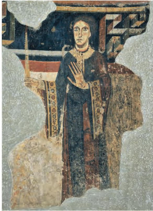
Fig. 1 – Sant Pere de Burgal, peintures de l’abside, la comtesse Lucia de la Marche