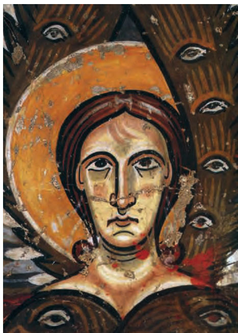
Fig. 9 – Àneu, église Santa Maria, peintures de l'abside déposées au MNAC, séraphin.