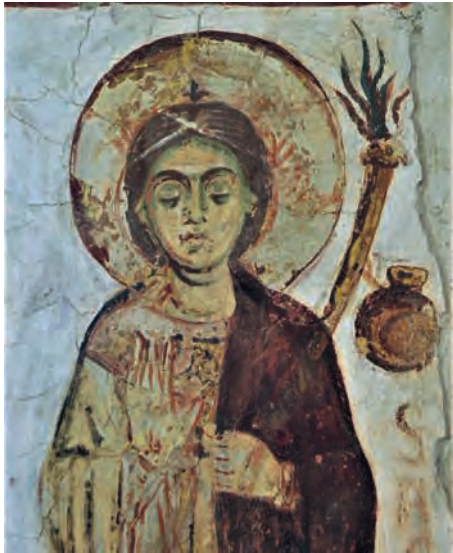
Fig. 17 – Civate, peinture de la crypte, sainte Agnès.

Elena Alfani a envisagé un rapprochement entre les visages du premier groupe catalan et ceux de Carugo dont elle a situé les peintures après 1105, autrement dit un siècle après Galliano : dans une scène de supplice, peut-être celui des martyrs de Sébaste, le bourreau présente un aspect général et des détails rappelant la première peinture catalane, comme la mèche de cheveux barrant le front et les ondulations du col (fig. 16) 56 . Le visage est toutefois émaillé d'ombres vertes, en particulier sous les yeux, ce qui n'apparaît guère en Catalogne, et les mèches de cheveux ne sont pas constituées de petits traits parallèles 57 . Ces analogies sont donc trop superficielles pour établir une continuité entre la Catalogne et la Lombardie des environs de 1100 58 .