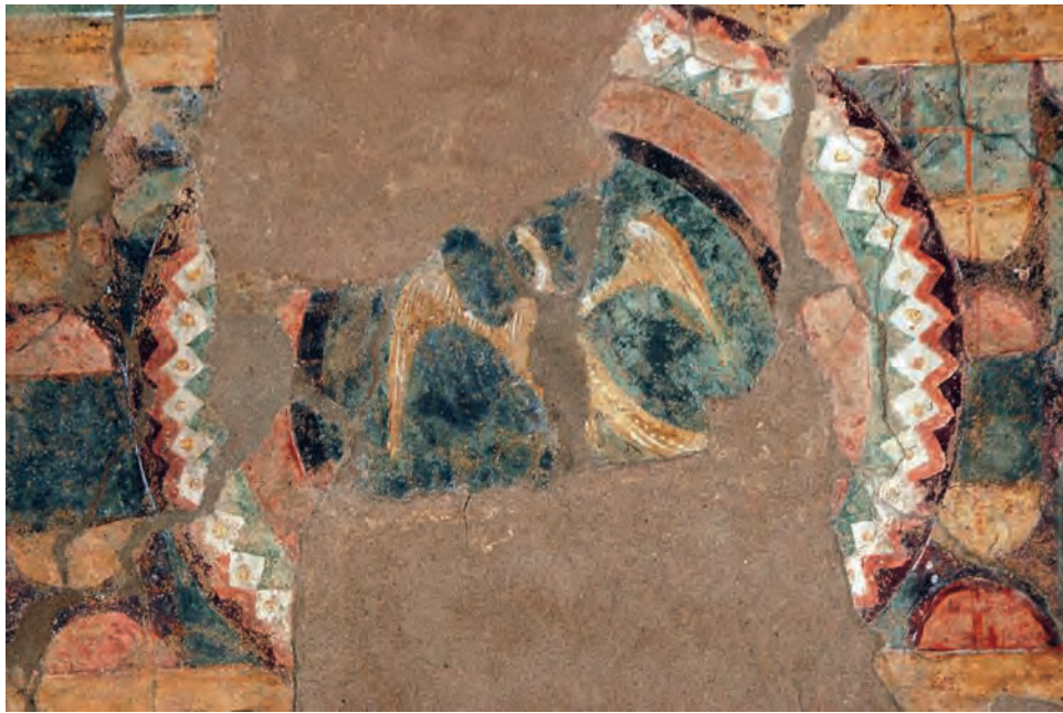
Fig. 15 – Galliano, église Saint-Vincent, décor de l’arc absidal, décor géométrique et aigle

Les pigments utilisés par les peintres lombards et catalans présentent de grandes différences, mais cette constatation peut difficilement être exploitée pour invalider cette hypothèse puisque les peintures des environs de l’an Mil ont disparu 50 . Il semble de surcroît logique que les seconds aient utilisé un pigment local comme l’aérinite plutôt que le lapis-lazuli qui devait être beaucoup plus coûteux et d’un accès plus difficile. C’est pourquoi les comparaisons entre les techniques des deux corpus devraient être étendues à l’examen des enduits, des pontate – qui apportent de précieuses informations sur l’organisation du chantier –, ainsi que des dessins préparatoires, des repentirs et de la stratigraphie. La prise en considération du nombre de couches picturales et leur agencement révèle notamment le processus pictural, le temps d’exécution et l’intérêt porté aux effets de volume 51 .