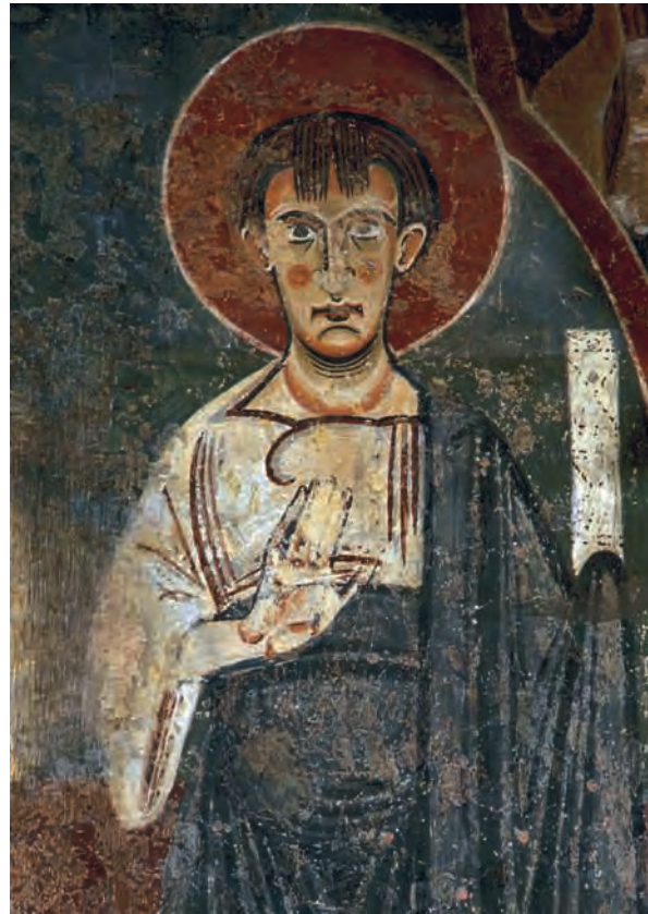
Fig. 12 – Saint-Lizier, cathédrale, peintures de l'abside apôtre.