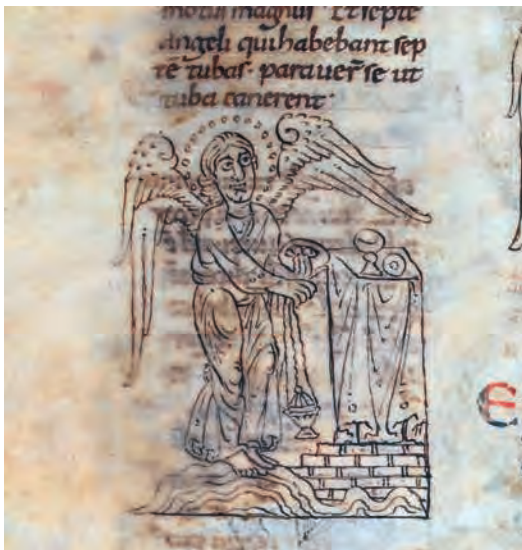
Fig. 4 – Bible de Rodes, Paris, BnF, ms lat. 6 (4), fol. 107v, l'ange à l'encensoir d'Apocalypse 8