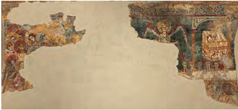
Fig. 19 – Pedret, église Sant Quirze, peintures du sanctuaire déposées au Museo Diocesa i Comarcal de Solsona, les martyrs sous l'autel encensé par l'ange d'Apocalypse 8 et foule d'anges (cl. du Museo Diocesa i Comarcal de Solsona).

On doit encore s'interroger sur les correspondances entre le programme apocalyptique de la crypte d'Anagni et celui de Pedret qui sont à la fois nombreuses et précises si l'on tient compte des différences de structure entre les deux espaces concernés : l'abside centrale d'une vaste crypte barlongue et un sanctuaire rectangulaire 66 . Dans l'axe de la composition figure l'Adoration de l'Agneau dominée par un Christ en gloire : la vision des chandeliers sur la voûte d'arête d'Anagni (Ap 1, 12-16) ; une Maiestas Domini sur la voûte en berceau de Pedret. À gauche, l'ange du chapitre 8 de l'Apocalypse encense l'autel sous lequel se tiennent les martyrs du chapitre 6, et la scène est précédée par des anges : quatre anges hexaptéryges dressés sur les roues de la vision d'Ézéchiel sur la voûte qui se déploie devant la scène à Anagni ; une foule angélique anonyme sans doute précédée par un ange hexaptéryge sur la paroi méridionale de Pedret, à côté de l'autel des martyrs (fig. 18 et 19). À droite, les quatre cavaliers du chapitre 6 galopent en s'éloignant du sanctuaire. S'ajoute à ce nombre remarquable de correspondances le Sacrifice de Melchisédech traité de manière très semblable dans les deux ensembles 67 . Le programme de Pedret présente donc plus d'affinités avec celui d'Anagni qu'avec les peintures plus anciennes de Saint-Hilaire de Poitiers qui se focalisent également sur le chapitre 6 de l'Apocalypse.