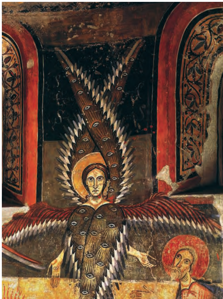
Fig. 24 – Àneu, église Santa Maria, peintures de l'abside déposées au MNAC, la Purification des lèvres d'Isaïe.

sans gloire lumineuse et les animaux de l'Apocalypse adoptent une position convergente 94 . En Lombardie au contraire, on conserve plusieurs exemples de Maiestates Domini dans lesquelles les Vivants s'orientent vers l'extérieur, comme en Cappadoce et en Catalogne. On peut citer à cet égard les peintures des églises de Gorlago et de Quinzano, et celles d'un manuscrit milanais du milieu du XII e siècle 95 . La peinture lombarde conserve également plusieurs représentations d'anges hexaptéryges et surtout un chérubin tétramorphe intégré dans le Jugement dernier de Riva San Vitale, ce qui demeure exceptionnel dans le monde roman.