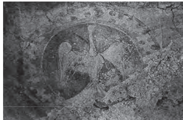
Fig. 14 – Saint-Michel de Cuxa, fragment de peinture d'une fenêtre de la nef, aigle (d'après J. Puig i Cadafalch [op. cit. n. 38]).