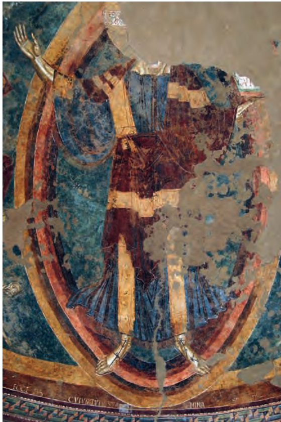
Fig. 11 – Galliano, église Saint-Vincent, le Christ en gloire.

Lorsqu'on compare ces caractéristiques aux œuvres catalanes, on s'aperçoit qu'elles ont généralement été transposées conjointement mais de manière plus graphique, avec une certaine sécheresse qui réduit considérablement les effets de volume et d'éclat lumineux. C'est particulièrement sensible pour le rouge des joues qui a été transformé en disques rouges, comme dans une grande partie du monde roman, et les cheveux dont les mèches retombant sur le front sont plus longues et artificiellement parallèles. Quant aux rehauts blancs encadrant les yeux, on les retrouve très significativement à Aneu, si ce n'est qu'ils ont été réduits à un trait unique, perdant ainsi leur tridimensionnalité et la majeure partie de leur éclat (fig. 9).