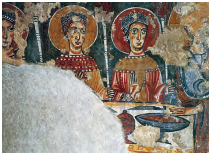
Fig. 8 – Pedret, église Sant Quirze, peintures de l'absidiole déposée au MNAC, les vierges sages.