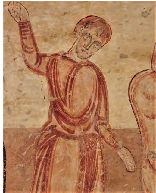
Fig. 16 – Carugo, église San Martino, scène de martyr.

Ce scénario expliquerait également que les peintures lombardes de la fin du x i siècle et de la première moitié du siècle suivant sont stylistiquement très différentes de celles de Galliano et de la Catalogne. Depuis l'invention du maître de Pedret, de nombreux ensembles de peintures romanes ont toutefois été découverts ou mis en évidence par des publications de grande qualité : Acquanegra sul Chiese, San Salvatore à Barzanò, Carugo, Gorlago, Sant Antonino de Piacenza et Valtravaglia 55 . Il faudrait par conséquent revoir en profondeur l'hypothèse de la connexion lombarde à la lumière de ces différents ensembles. Celui de Sant Antonino de Piacenza est particulièrement important à cet égard puisqu'il comble le vide séparant les peintures de Galliano de celles de la seconde moitié du x i siècle, et que ses frises ornamentales font écho à celles du groupe de la vallée d'Àneu et de Pedret. Les figures sont en revanche très différentes.