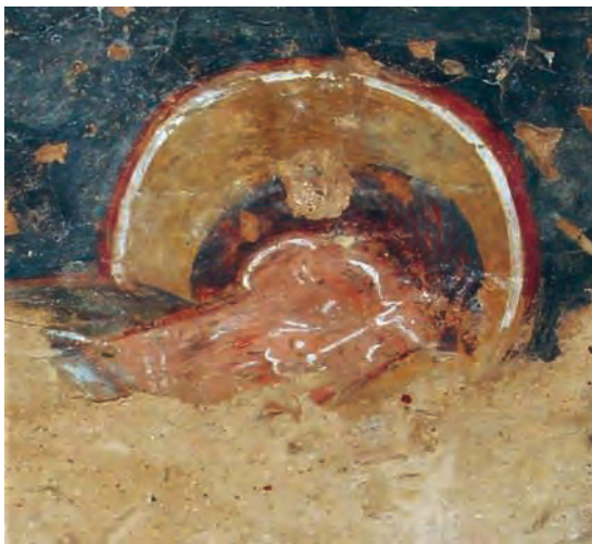
Fig. 25 – Canapost, église Sant Esteve, peintures de la voûte de la « fausse croisée du transept », détail d'un apôtre.

Poitou. Quelle que soit la chronologie exacte du groupe poitevin, celui-ci contribue à enrichir le panorama de la peinture catalane et confirme qu'elle a bénéficié d'impulsions émanant des grands courants artistiques. Ce groupe apporte également un important élément de réflexion au sujet de la diffusion des formes. Il recouvre en effet une aire géographique relativement circonscrite sur une latitude située globalement au niveau de Vic et de Gérone, il comporte des églises appartenant à ces deux diocèses et ne présente pas d'influence marquée des deux autres grands groupes. Ce type de diffusion localisée peut également être observée à une échelle beaucoup plus modeste au sujet des peintures de Saint-Martin-de-Fenollar et des Cluses-Hautes 103 . Et même dans ce groupe limité à deux ensembles, les techniques diffèrent, révélant peut-être l'intervention de deux peintres distincts 104 . Ces deux groupes suggèrent donc que les courants artistiques ne se sont guère mélangés et qu'ils sont restés cantonnés dans des secteurs géographiques relativement circonscrits. Ces observations confortent dès lors l'hypothèse proposée précédemment selon laquelle les pratiques d'ateliers se transmettent beaucoup plus difficilement que les modèles iconographiques.