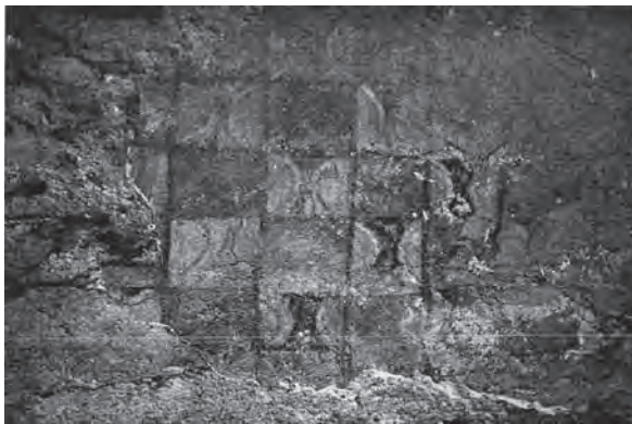
Fig. 13 – Saint-Michel de Cuxa, fragment de peinture d'une fenêtre de la nef, décor géométrique (d'après J. Puig i Cadafalch [op. cit. n. 38]).

Ces rapprochements stylistiques demeurent très partiels et mériteraient d'être étendus à l'ensemble des corpus catalan et lombard et de leurs innombrables composantes picturales susceptibles de révéler les usages des praticiens. Ils semblent néanmoins suffisamment nombreux et précis pour fonder l'hypothèse de transferts artistiques émanant de la Lombardie.