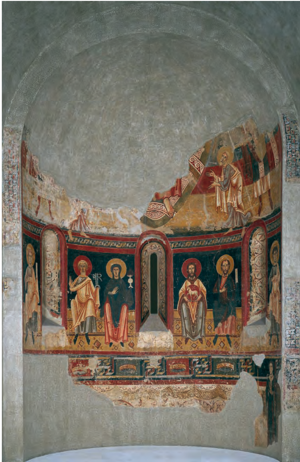
Fig. 20 – Burgal, église Sant Pere, peintures de l'abside déposées au MNAC.