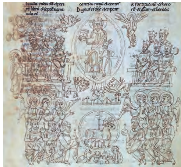
Fig. 5 – Bible de Rodes, Paris, BnF, ms lat. 6 (4), fol. 105v, la vision de l'Anonyme.

été redatées au vi siècle, et celles de Santa Maria de ce même ensemble monumental, situées à la fin du ix siècle, mais ces œuvres se démarquent très nettement des peintures romanes 29 .