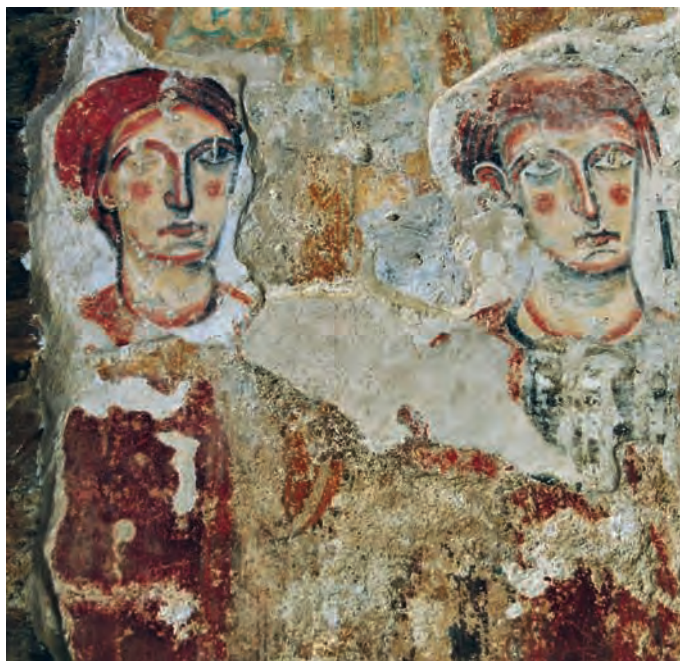
Fig. 10 – Burgal, église Sant Pere, peintures de la paroi septentrionale de l'arc absidal, deux personnages anonymes.