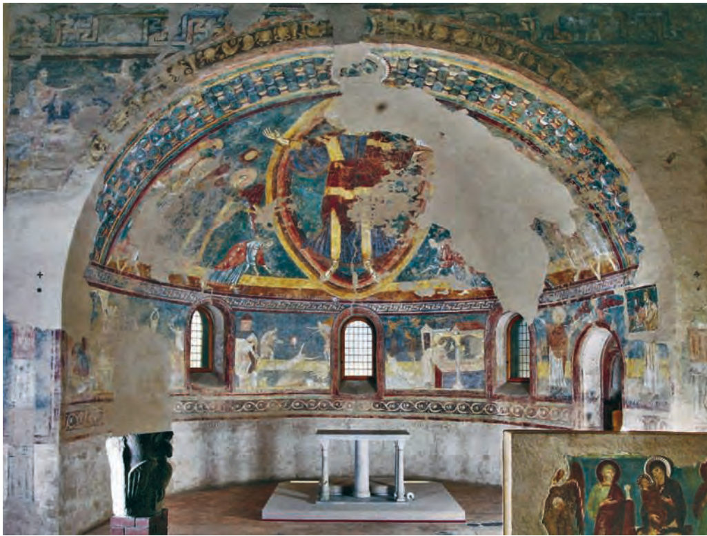
Fig. 6 – Galliano, église Saint-Vincent, peintures de l'abside (cl. de Sara Munari, Université catholique du Sacré-Cœur, Milan).