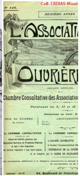
JPEG - 58.6 ko 349 x 480 pixels

Pour citer cet article : https://maitron.fr/spip.php?article237048 , notice Les sociétés coopératives de production par Maxime Quijoux, version mise en ligne le 26 janvier 2021, dernière modification le 30 août 2021.