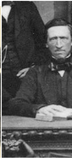
JPEG - 71.5 ko 304 x 400 pixels