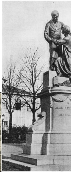
JPEG - 308.8 ko 620 x 885 pixels