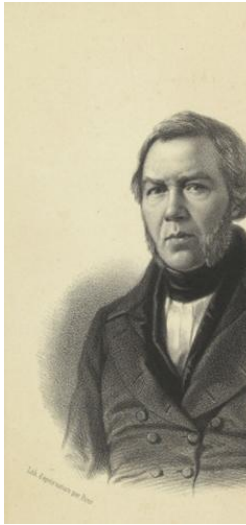
JPEG - 133.4 ko 394 x 500 pixels