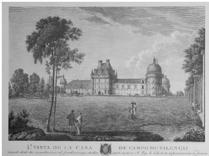
Ill. 5. 4a vista de la casa de campo de Valençay, par Felipe Cardano, 1 er quart du XIX e siècle – Gravure sur papier (collection Château de Valençay). Un cirque fut installé sur cette pelouse (aujourd'hui le jardin français) lors de la fête de l'empereur, le 15 août 1810.

Valençay, invité par le conseiller de préfecture à faire surveiller ledit Lonati, ce dernier arriva à Valençay le 31 juin [sic] pour en repartir dès le 1 er juillet 203 . On peut supposer que c'est ce même Cirque Franconi qui intervint lors de la fête de l'empereur 204 . Comme lors de la précédente cérémonie, un feu d'artifice, des illuminations — une étoile de la Légion d'honneur avait été placée sur le point culminant du château — et un concert dans les appartements des princes, au cours duquel fut peut-être exécuté le Chœur de guerriers de J.-B. Métoyen 205 , terminent la fête.