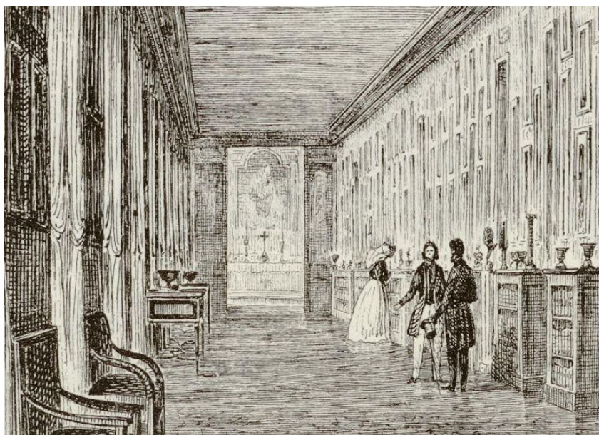
Ill. 4. Vue de la « galerie de gravures » (détail), avec la chapelle située au fond, gravure réalisée d'après les dessins d'Isidore Meyer, publiée dans M. de La Villegille, « Valençay », Esquisses pittoresques sur le département de l'Indre , Châteauroux, J.-B. Migné, 1854, p. [270].

aménager une galerie afin d'exposer les gravures et tableaux de M. Rolland, marchand d'estampes, arrivé à Valençay le 19 octobre 1812 186 .