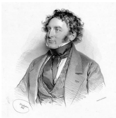
Ill. 3. Robert-Nicolas-Charles Bochsa – Lithographie de Fritz Kriehuber, 1842