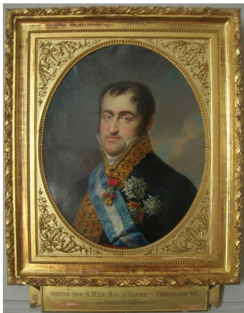
Ill. 1. Portrait de Ferdinand VII , par Vicente Lopez, vers 1815-1820. – Huile sur toile, cadre et cartel en bois doré (collection Château de Valençay).

l'attention portée à l'état d'esprit des princes est extrême et celui-ci n'est pas sans conséquences sur les distractions proposées. Le préfet, informé par le maire de Valençay des mouvements de voyageurs et d'étrangers ayant fait viser leurs passeports à la mairie, transmet régulièrement la liste de ces derniers, qu'il joint à ses rapports, à sa hiérarchie. Rapports et listes de voyageurs ne sont cependant pas conservés en ordre chronologique, mais dispersés dans les nombreux dossiers thématiques ouverts aux noms des principaux hôtes du château ayant fait l'objet d'une surveillance approfondie.