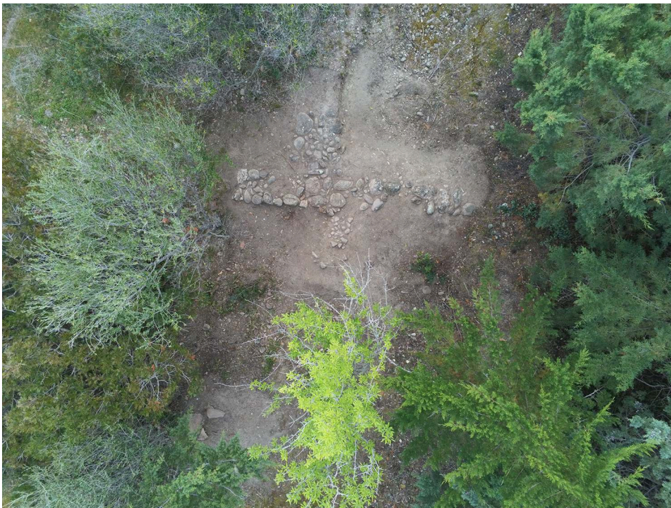
Fig. 2 – Vue générale de la tranchée