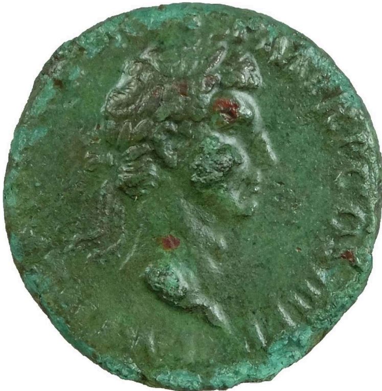
Fig. 2 – Avers d'une monnaie de Nerva frappée en 97 apr. J.-C. à Rome, après sa stabilisation