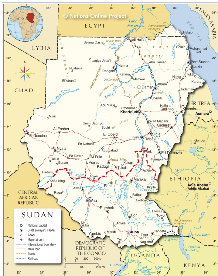
Fig. 1 : Carte du Soudan avant la partition de 2011, indiquant la limite entre le Nord et le Sud (en rouge) 2 .

2011, pays engagé dans une « transition » après un accord de paix signé entre le Nord et le Sud mettant fin à l'une des guerres civiles les plus longues qu'ait connues le continent africain à l'ère post-coloniale (1955-1972 et 1983-2005). Le 9 janvier 2005, le gouvernement soudanais du National Congress Party (NCP) et le Mouvement populaire de libération du Soudan (Sudan People's Liberation Movement, SPLM), mouvement rebelle sud-soudanais, signent un accord de paix, le Comprehensive Peace Agreement (CPA), à Naivasha (Kenya), sous les auspices de la diplomatie américaine. Tout en s'engageant à rendre « attractif » le maintien d'un Soudan unitaire, l'accord prévoit la tenue d'un référendum sur l'indépendance du Sud au terme d'une période transitionnelle de six ans. Le vote des Sud-Soudanais, massivement favorable à l'indépendance (98,8 % des voix), conduit à la partition du pays et à la sécession effective du Soudan du Sud le 9 juillet 2011 (Aalen, 2013 ; Johnson, 2013).