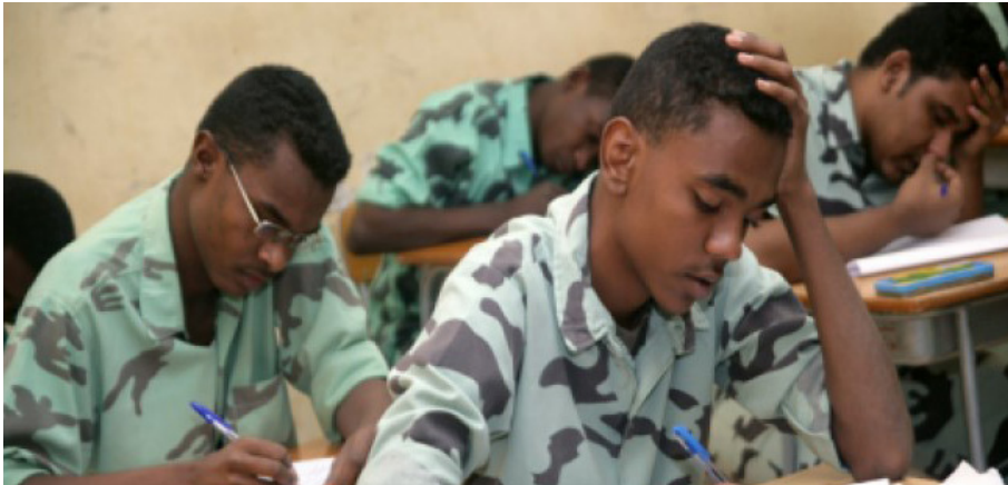
Fig. 3 : Lycéens soudanais portant l'uniforme scolaire en 2015 9 .