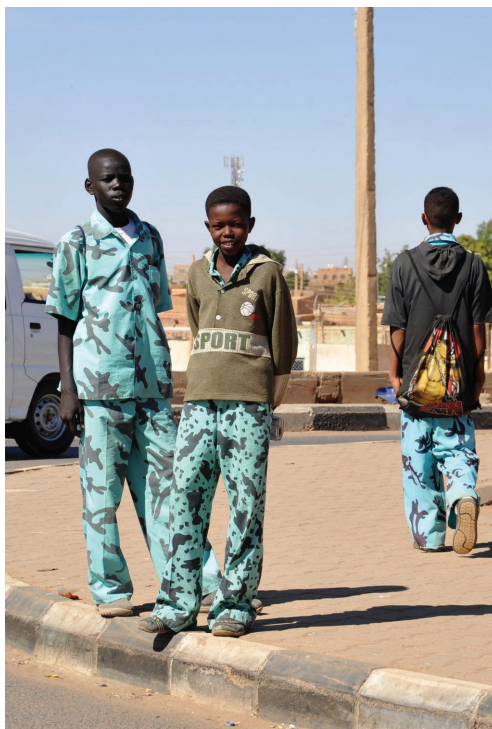
Fig. 2 : Élèves soudanais portant l'uniforme scolaire en 2009 8 .

Cependant, d'autres facteurs révèlent l'importance des sciences militaires, dès lors que celles-ci sont appréhendées comme une partie d'un processus plus large de militarisation de l'enseignement à l'œuvre dès le début des années 1990 (al-Bašīr, 2017, p. 194). Une telle dynamique est discernable non seulement dans l'introduction d'une nouvelle matière explicitement dédiée au domaine militaire au niveau lycée, mais également dans la prééminence d'un lexique martial dans les supports pédagogiques d'autres matières telles que la langue arabe, la religion musulmane, l'histoire, la géographie et la littérature, ceci dès le niveau élémentaire (Guta, 2009, p. 82-85 ; al-Bašīr, 2017, p. 305-308). La militarisation de l'univers scolaire sous le régime de l' 'inqād se lit à la fois dans les manuels et sur les corps des élèves, tenus de porter un uniforme aux motifs particulièrement explicites (fig. 2 et 3).