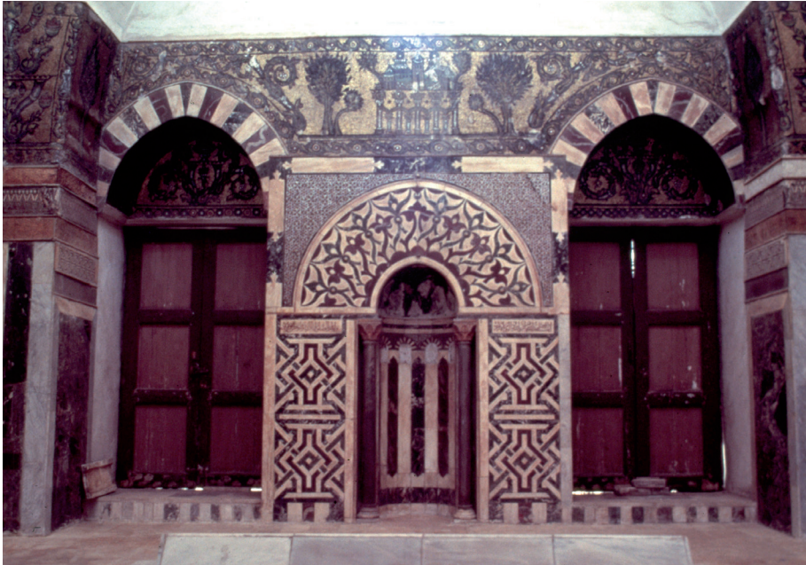
Salle du tombeau de Baybars (avant restauration)