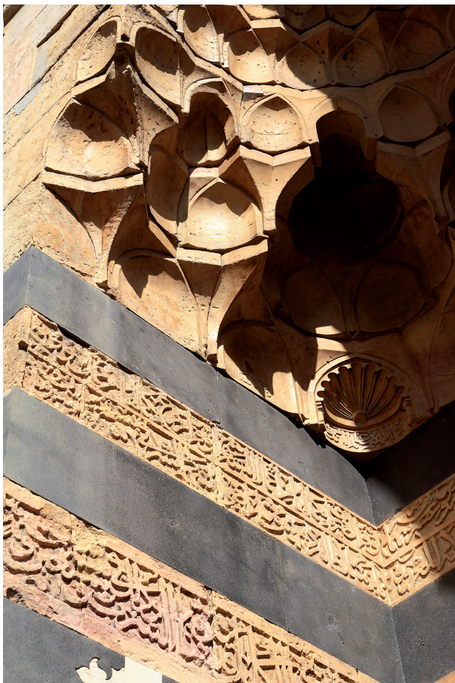
Détail de l'entrée de la madrasa al-Zāhiriya