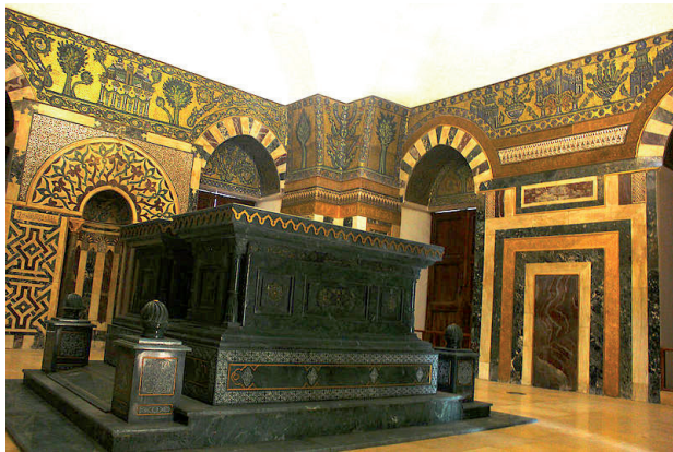
Tombeaux du sultan Baybars et de son fils al-Malik al-Sa'ïd (après restauration)