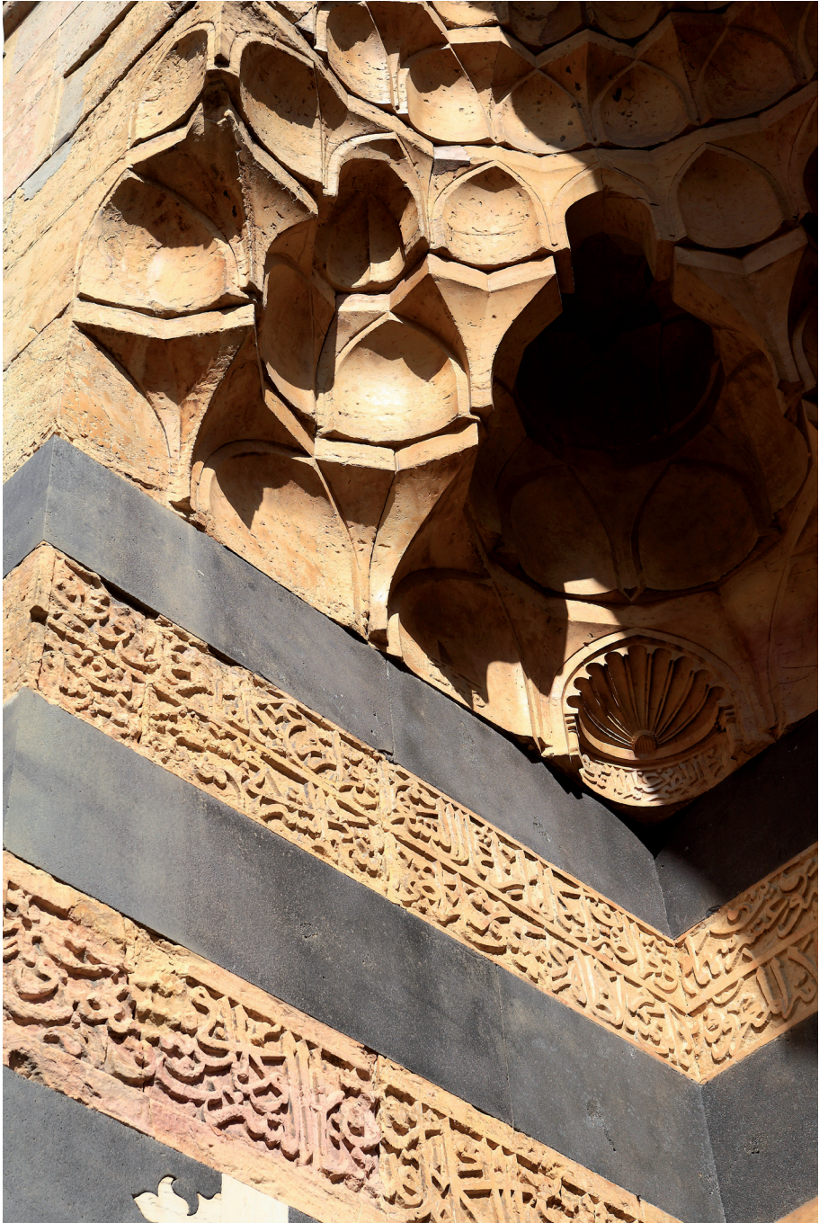
Détail de l'entrée de la madrasa al-Zāhiriya