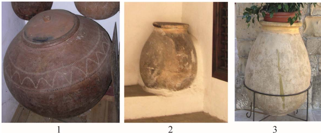
Fig. 8. 1, pitharia à Chypre ; 2 et 3, jarres de Biot à Nicosie.

On en retrouve également la trace à Kyrénia, Nicosie et Potamia, où elles sont recyclées en pot pour les plantes ( fig. 8 : 3 ). Les contenants de terre employés dans les maisons des Français de Larnaka pour le stockage des denrées sont, à l'exception des jarres de Biot, probablement tous d'origine locale. Un examen des productions des ateliers du Troodos aux XIX e et XX e siècles permet d'imaginer qu'elles pouvaient être leurs formes car, comme le révèlent les découvertes archéologiques, il semble y avoir eu une grande continuité dans le mode de fabrication et les types produits depuis l'époque byzantine jusqu'à une date récente 385 . Dans les caves et les cuisines, parfois dans les chambres, les chanceliers reconnaissent trois entonnoirs de cuivre, six de fer blanc et dix autres sans qualificatif de matière, des ustensiles