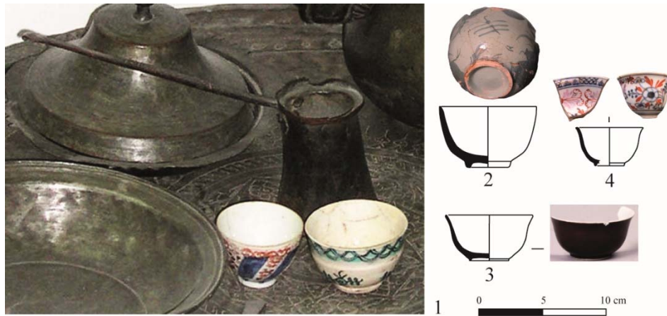
Fig. 7. 1, fincan de Kütahya à Limassol ; 2, tasse à café en faïence de Ligurie a tapezzeria , fin du XVII e -début du XVIII e siècle à Alep ; 3, tasse en porcelaine de Chine à Damas ; 4, tasse en porcelaine de Meissen.