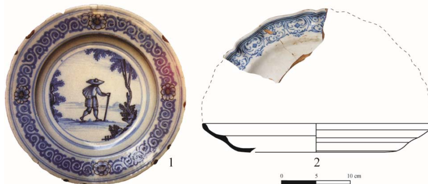
Fig. 4. 1, faïences de Saint-Jean-du-Désert (d'après Desnuelle, La Faïence à Marseille au XVII e siècle ) ; 2, faïence de Varages.

Il est possible par ailleurs que les Provençaux de Larnaka fassent venir de Marseille les premières productions de faïence qui se développent durant le dernier quart du XVII e siècle et au début du XVIII e dans les ateliers de Saint-Jean-du-Désert, un faubourg de la ville, telle cette assiette à large bord, peinte en camaïeu de bleu et manganèse sur une belle couverte blanche 225 ( fig. 4 : 1 ). En l'absence de vestiges trouvés en fouille, à Chypre et en Méditerranée orientale, il est difficile d'affirmer que ces premières faïences marseillaises sont commercialisées en dehors des limites régionales. Cependant, des faïences provençales, de Varages et Moustiers, sont employées sur les tables d'Izmir, d'Alep et de Damas dès le premier tiers du XVIII e siècle 226 ( fig. 4 : 2 ).