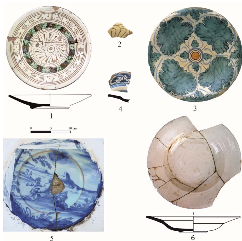
Fig. 3. Productions pisanes, XVII e siècle : 1 et 2, céramiques graffita à décor piumaggio (d'après Abel, Bouiron, Parent, Fouilles à Marseille ) et à Paphos ; 3, majolique de Montelupo à décor « feuilles de chêne » (d'après Berti, Storia della Ceramica di Montelupo ). Productions ligures, seconde moitié du XVII e siècle ; 4, faïence foglie di palma à Nicosie ; 5, faïence au décor tappezeria en Thessalie ; 6, faïence de Ligurie à Nicosie.

On reconnaît sur l'île, dans les fouilles de Fabrika à Paphos 214 , un fragment de graffita de Pise au décor piumaggio incisé et rehaussé de pigments verts et jaunes du milieu du XVII e siècle 215 ( fig. 3 : 1 et 2 ). Les céramiques de Toscane sont aussi représentées, à Famagouste et à Kouklia 216 , par des assiettes émaillées à décor « feuilles de chêne » des ateliers de Montelupo, d'une phase de production de la fin du XVII e siècle 217 ( fig. 3 : 3 ).