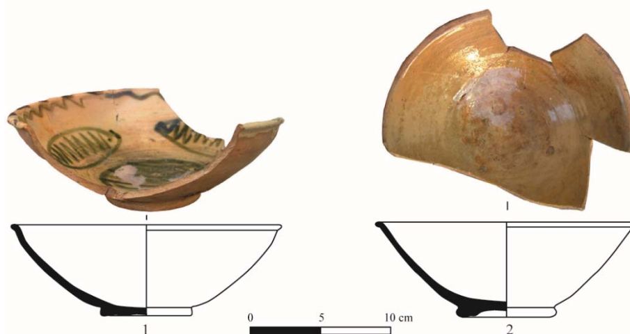
Fig. 5. 1 et 2, coupes vernissées des ateliers de Lapithos, XVII e siècle.

Les productions de céramiques chypriotes du XVII e siècle ne peuvent rivaliser avec la vaisselle vernissée et les assiettes émaillées importées d'Italie et peut-être de France qu'on situe entre le luxe et l'ordinaire. À cette époque en effet, la vaisselle de terre à Chypre est fabriquée dans les ateliers de Lapithos, au nord de l'île où des potiers étaient déjà en activité dès la fin du XIV e siècle 227 . De récentes découvertes révèlent l'existence d'une production de coupes profondes datée à partir de la première moitié du XVII e siècle 228 . Finement tournées dans une pâte argileuse de couleur chamois, ces coupes à panse hémisphérique terminée par une petite lèvre éversée et montées sur des bases annulaires très plates à disque interne, sont ornées de décors géométriques tracés en vert kaki sur une très fine couche d'engobe rosé ou beige couverte d'une glaçure plombifère incolore appliquée en jus pauvre ( fig. 5 : 1 et 2 ). D'autres coupes profondes sont simplement couvertes d'une glaçure jaune pâle ou vert émeraude.