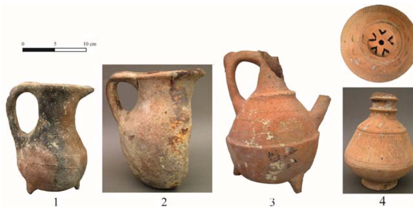
Fig. 10. 1 à 4, cruches de terre du Troodos à Nicosie, XVII e siècle.