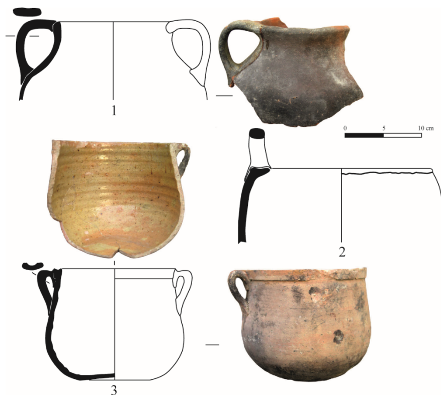
Fig. 1. 1 et 2 marmites de Kornos, première moitié du XVII e siècle ; 3, marmite de Vallauris à Nicosie, début du XVIII e siècle.