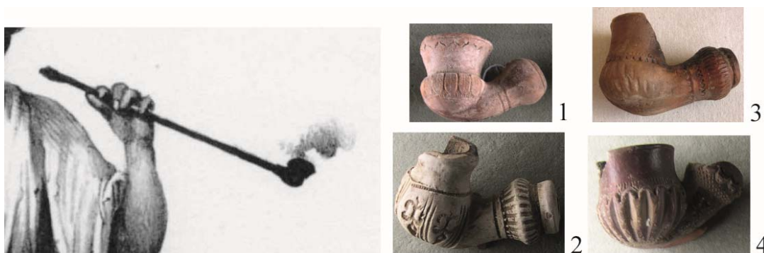
Fig. 6. Fourneaux de pipes ottomanes en terre à Nicosie et Potamia.