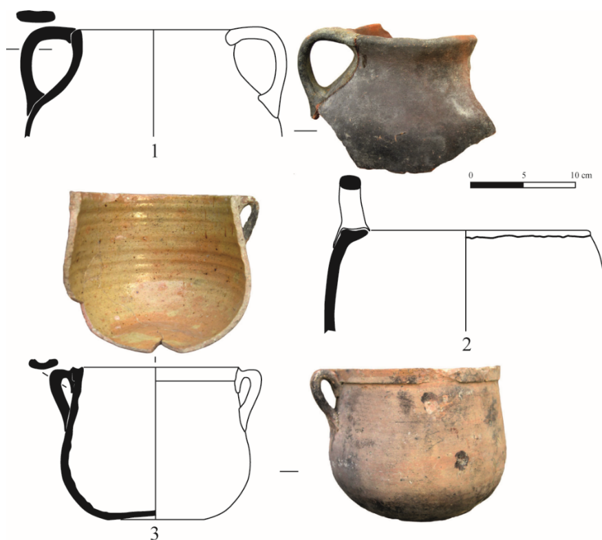
Fig. 1. 1 et 2 marmites de Kornos, première moitié du XVII e siècle ; 3, marmite de Vallauris à Nicosie, début du XVIII e siècle.

Les récipients de cuisson en métal et en terre sont majoritairement trouvés dans les cuisines où dans les pièces attenantes et remisés dans les caves, mais ils apparaissent aussi dans les chambres et les salles. Présents dans les boutiques et les magasins, ils ont un usage spécifique telle cette « marmite de fer pour faire bouillir la poix » chez le marchand François Courey 165 et ces « poilles de fer » destinées à la vente dans deux petites caisses et trois grandes marmites « servant aux vaisseaux » dans le grand magasin du premier député André de Saint-Amand 166 . Deux marmites de cuivre usées et leurs couvercles, deux trépieds, un grand et un petit, un gril et un foyer ainsi que quatre cuillers de bois constituent une part de l'équipement de la barque Saint-Pierre 167 .