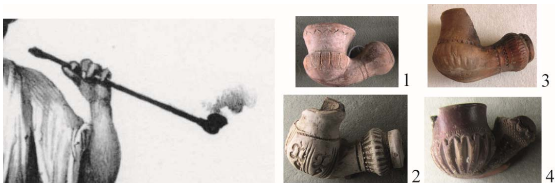
Fig. 6. Fourneaux de pipes ottomanes en terre à Nicosie et Potamia.