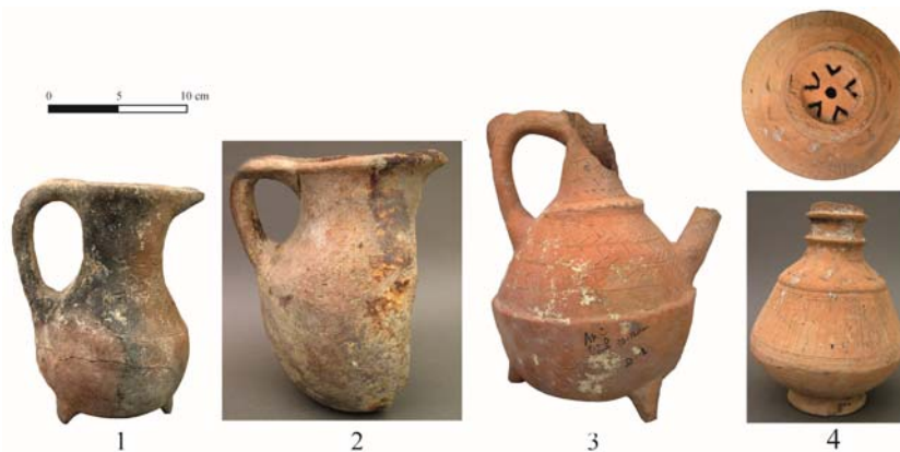
Fig. 10. 1 à 4, cruches de terre du Troodos à Nicosie, XVII e siècle.