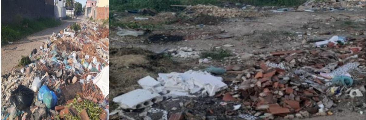
Figure 3 - Mosaïque de photos des points 2 et 3 d'élimination irrégulière des déchets, dans le quartier Passaré, Fortaleza, Ceará, Brésil