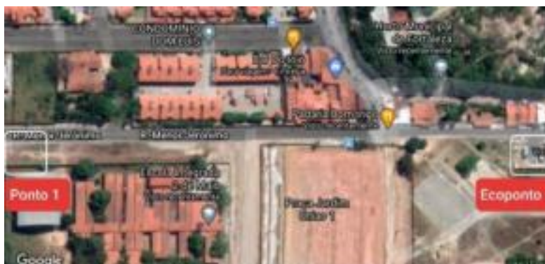
Figure 2 – Localisation de l'un des points de stockage critiques dans le quartier Passaré, Fortaleza, Ceará, Brésil.