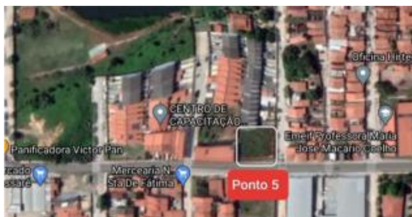
Figure 4 – Localisation du point d'élimination irrégulière 5 à quartier Passaré, Fortaleza, Ceará, Brésil.