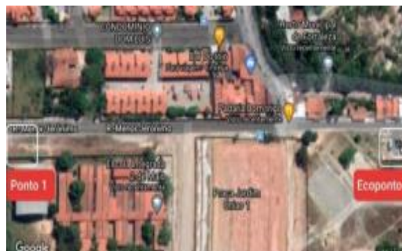
Figure 2 – Localisation du dépôt sauvage du Point 1 (à gauche) et de l'écopoint (à droite)

L'un de ces points critiques (point 1, voir Figure 1) dispose à une distance de 400 m d'un site « Écopoint » dédié à l'apport volontaire de matériaux recyclables, telles que les papiers / cartons, le verre, etc. (voir Figure 2).