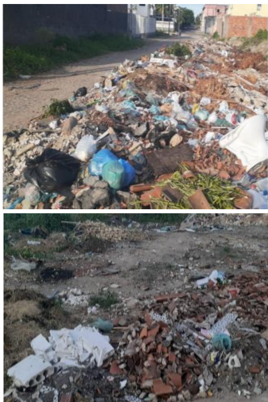
Figure 3 - Photos des points 2 (en haut) et 3 (en bas) d'élimination irrégulière des déchets, dans le quartier Passaré de Fortaleza, Ceará, Brésil

Les points 4 et 5 présentent une plus grande prédominance de déchets ménagers. Le Point 5 attire l'attention car il est situé sur l'une des artères principales du quartier Passaré, Avenida Presidente Costa e Silva également connue sous le nom d'Avenida Perimetral (voir Fig. 4).