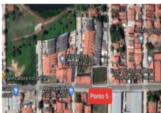
Figure 4 – Localisation du point 5 d'élimination irrégulière du quartier Passaré, Fortaleza, Ceará, Brésil.

Les points 4 et 5 présentent une plus grande prédominance de déchets ménagers. Le Point 5 attire l'attention car il est situé sur l'une des artères principales du quartier Passaré, Avenida Presidente Costa e Silva également connue sous le nom d'Avenida Perimetral (voir Fig. 4).