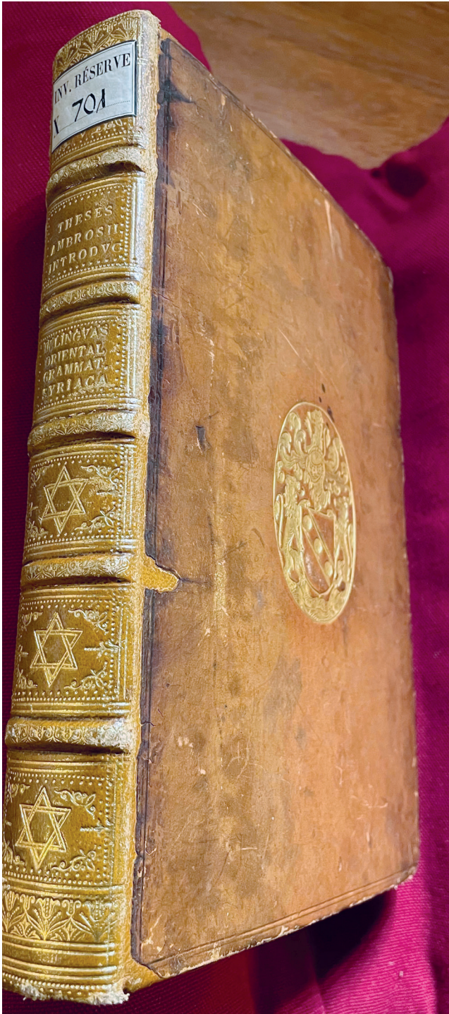
4. Teseo Ambrogio, Introductio in Chaldaicam linguam , 1539, Bibliothèque nationale de France, X 701, dos et plat supérieur, cliché M.-L. Demonet