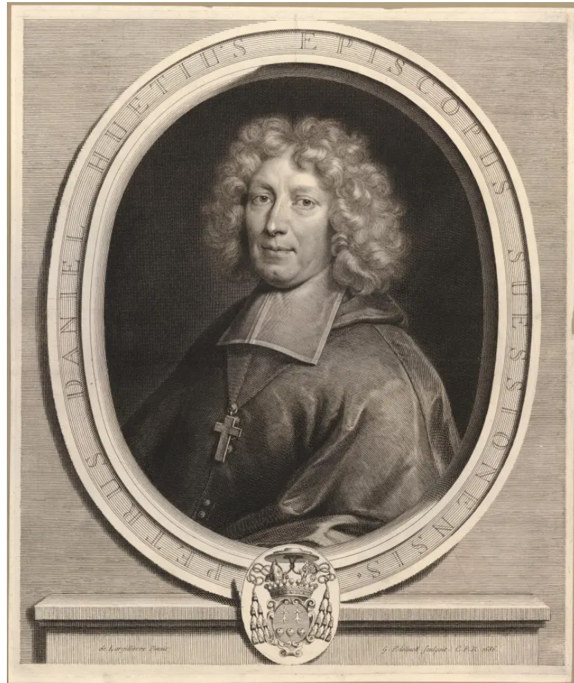
Gérard Edelinck after Nicolas de Largillière, Portrait of Pierre-Daniel Huet