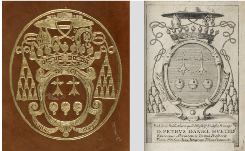
Huet's supralibros and bookplate

For me, the “Pierre-Daniel Huet manuscript material” at NYPL demonstrates in a nutshell the scope and appeal of Huet’s correspondence and the need for a critical, annotated edition of it. To be sure, such a project could only be carried out by a team of scholars of encyclopedic competence and would represent a huge, truly Benedictine labor. In the meantime, establishing a precise and comprehensive inventory of the extant papers would already be a great start and provide a most welcome resource for seventeenth-century studies.