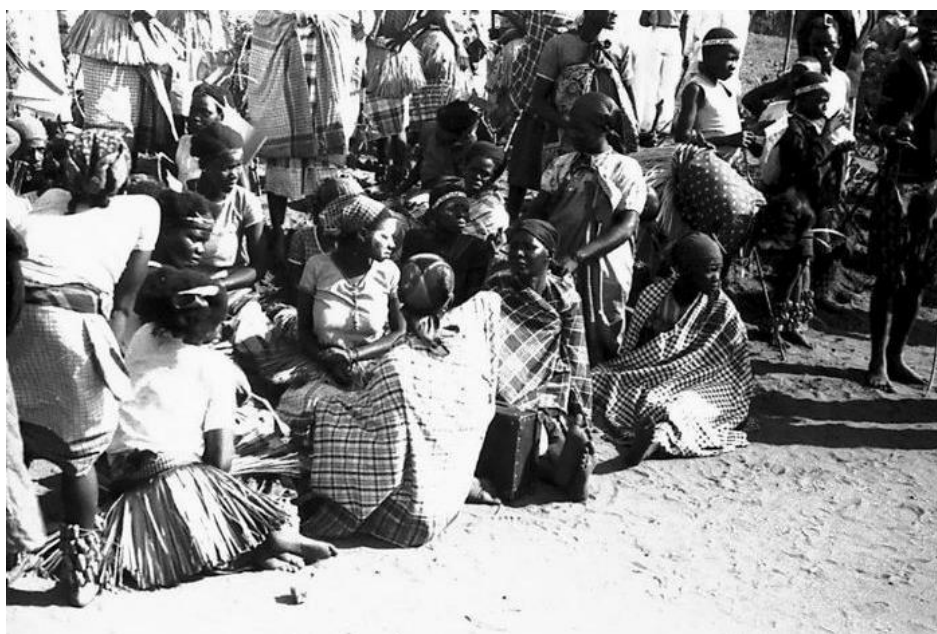
Fig. 8. Foto EC.Africa.I.033, Archivio contemporaneo del Gabinetto Vieusseux. Inedita

A vederli, accosciati, in lunghissime file, con lo scudo, le clave e le zagaglie posate a terra in un certo ordine militaresco, non nego che sul primo facessero impressione. Era tutto un brulichio di penne e pennacchi, ciuffi di pelo, code di volpe, sul lustrare untuoso delle membra nere. Le donne e i ragazzi li avevano accantonati in disparte 65 .