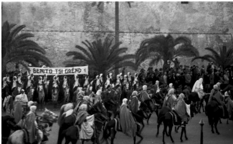
Fig. 7. Foto EC.Libia.II. 076, Archivio Contemporaneo del Gabinetto Vieusseux. Inedita

questa. Fotograf(a)i molto nel viaggio: teste, teste, ecc., chi sa cosa è venuto; perché tutto è stato fatto con furia pazzesca, sfrenata» 64 .