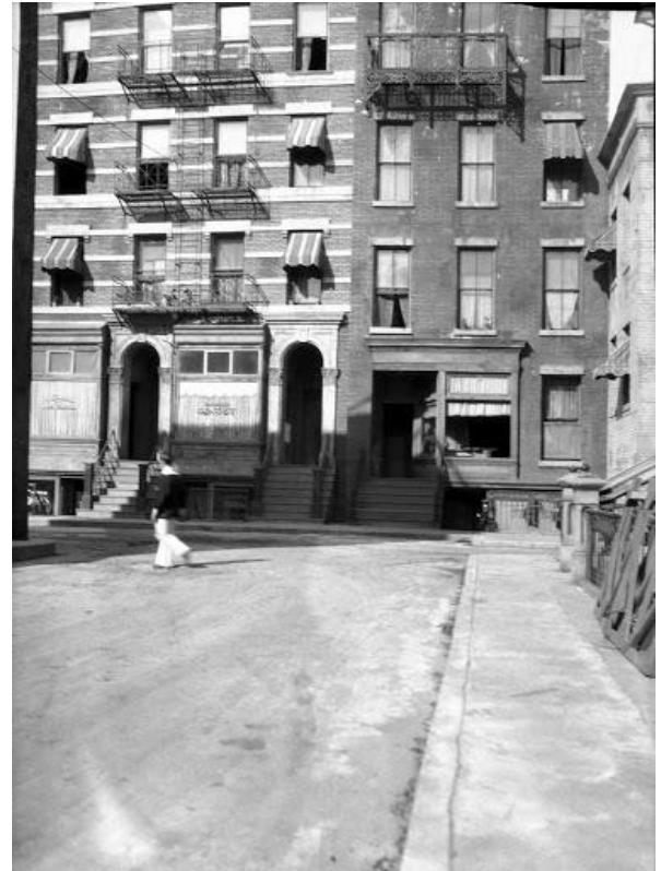
Fig. 5. Foto EC.7.2.052, Archivio Contemporaneo del Gabinetto Vieusseux. Inedita

Oltre alle tre tipologie di corrispondenze su cui ci si è finora soffermati, è utile rilevare anche la presenza di metafore e similitudini fotografiche, anch'esse sintomo dell'influenza di questo medium sul pensiero e sulla scrittura di Cecchi. Figure di questo tipo sono impiegate quando il termine di partenza è variamente implicato con il processo di visione; l'autore fa riferimento all'aspetto che assume ciò che lui osserva, e lo definisce paragonandolo a elementi pertinenti alla fotografia. Così alcune scene cui assiste vengono comparate a fotomontaggi, per l'affastellarsi di elementi diversi («Ma perfino i pompieri di Città del Messico, con macchine d'ultimo modello [...] e l'omino a bodo che batteva il gong disperatamente [...]: perfino i pompieri sembravano