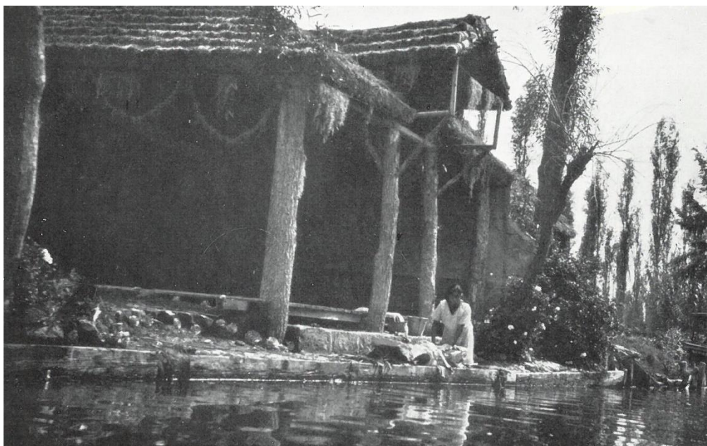
Fig. 1. Foto EC.7.2.095, Archivio Contemporaneo del Gabinetto Vieusseux. Edita come foto n. 14 in Messico (1932), con il titolo: «Giardini galleggianti». Xochimilco

verande, donne indiane, che sembrano in camicia da notte, inginocchiati sull'acqua lavano panni. Guardano di sotto in su, fra la chioma nera e unta, e nell'ombra del viso balena il bianco dell'occhio 31 .