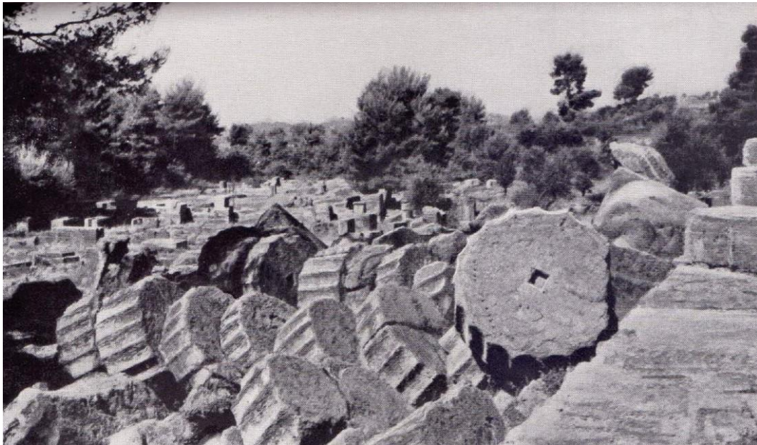
Fig. 3. Foto EC.Grecia.I.062, Archivio Contemporaneo del Gabinetto Vieusseux. Edita come foto n.30 in Et in Arcadia ego (1936), con il titolo: Rovine del tempio di Zeus, Olimpia

La fotografia qui riportata (fig.3), che è solo una delle numerose (circa 25) scattate presso il sito archeologico, appare proprio all'origine dell'immagine verbale. La peculiarità materiale del lumachello e l'apparenza ondosa che assumono i pezzi di templi e edifici riversi al suolo, perfettamente registrata nello scatto, si congiungono nella vivificazione della fotografia attraverso la narrazione.