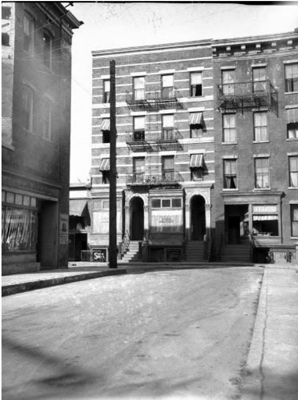
Fig. 4. Foto EC.7.2.051, Archivio Contemporaneo del Gabinetto Vieusseux. Inedita