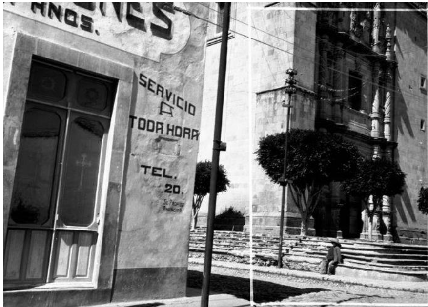
Fig. 6. Foto EC. VII.2.149, Archivio Contemporaneo del Gabinetto Viesseux. Inedita